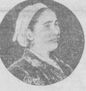
эмас. Биз имконият борича мўл ҳосил етиштириш учун курашаберамиз.

Мен бу йил Турсуной нондан бериб комплекс механизациялаштирилган бригадага бошчилиги қилиш, кам меҳнат сарф қилиб арзон баҳода мўл ҳосил етиштиришга аҳд қилдим. Совхоз дирекцияси бизнинг икти-ришимизга 60 гектар ер ажратиб берди. Бу ерларни ўтган йилнинг кун-зидаёқ сифатли ҳайдаб, ўргитлаб