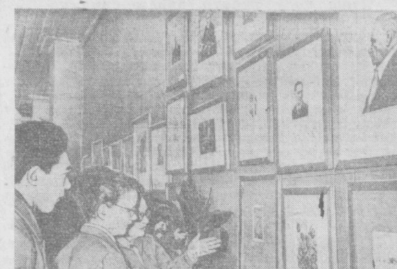
Суратда: виставка залларида.

Бундан бир неча кун муқаддам Чехословакия республикаси Совет Иттифоқига махсус чех рассомчи Макс Швабинский графика асарлари виставкасини юборган эди. Яқинда Ўзбекистон ССР Давлат санъати музейида Чехословакия халқ рассомси, профессор М. Швабинский асарлари виставкасининг очилиш маросими бўлди.