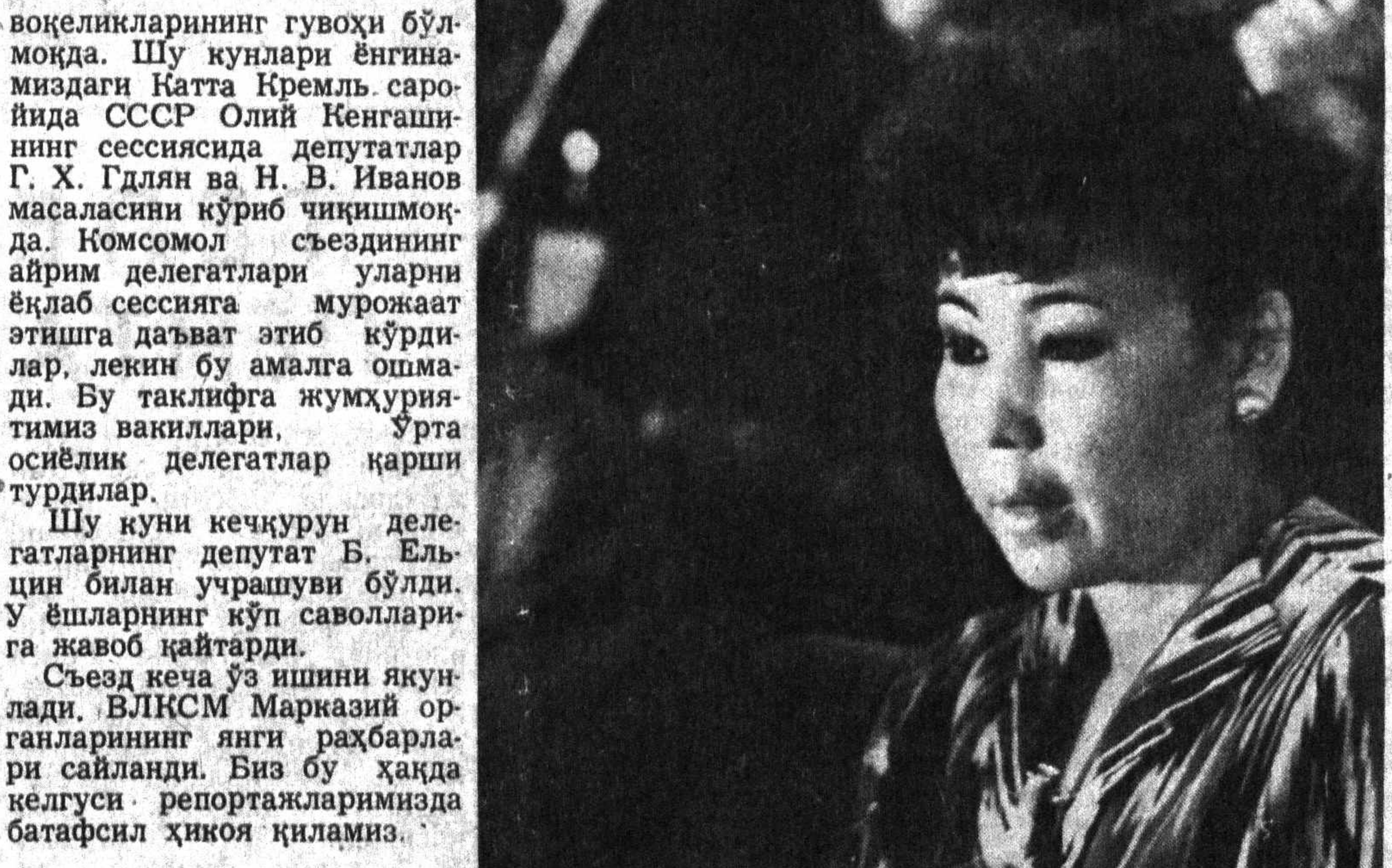
Суратларда: ўзбекистонлик съезд делегатлари.