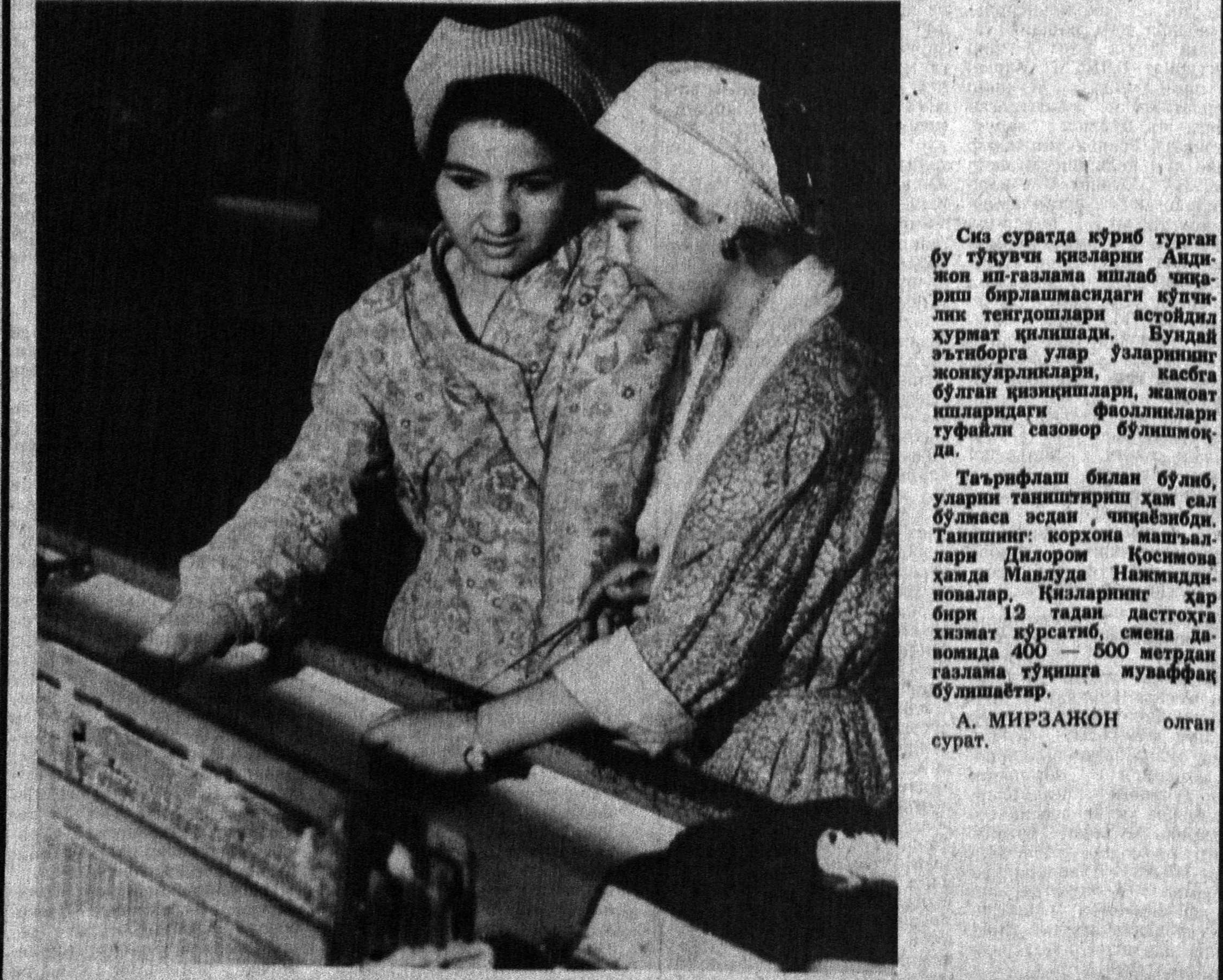
Сиз сурагда кўриб турган бу тўкувчи қизларни Андижон ип-газлама ишлаб чиқариш биришмасидаги кўчлики тенгдошлари асғойдил хурмат қилишди. Бундай эътиборга улар ўзларининг жонқуярликлари, касбга бўлган қизиқишлари, жамоват ишларидеги фаолликлари тўғрисида сазовор бўлишмоқда.

ди. Венгрия Социалистик партиясининг президиумининг сиездини ички босқичда ўтказишга қарор қилди. 26-27 май кунлари режалаштирилган биринчи босқич чоғида партиянинг сиесий йўлини ишлаб чиқиш, ВСР Уставига тузатишлар киритиш, унинг раҳбариятини сайлаш режалаштирилмоқда. Шу йилнинг кузида ўтказилиши мўлжалланган иккинчи босқич давомида ички партиянинг мунозара неғизда ишлаб чиқилган партиянинг янги стратегик программаси муҳокама қилинади.