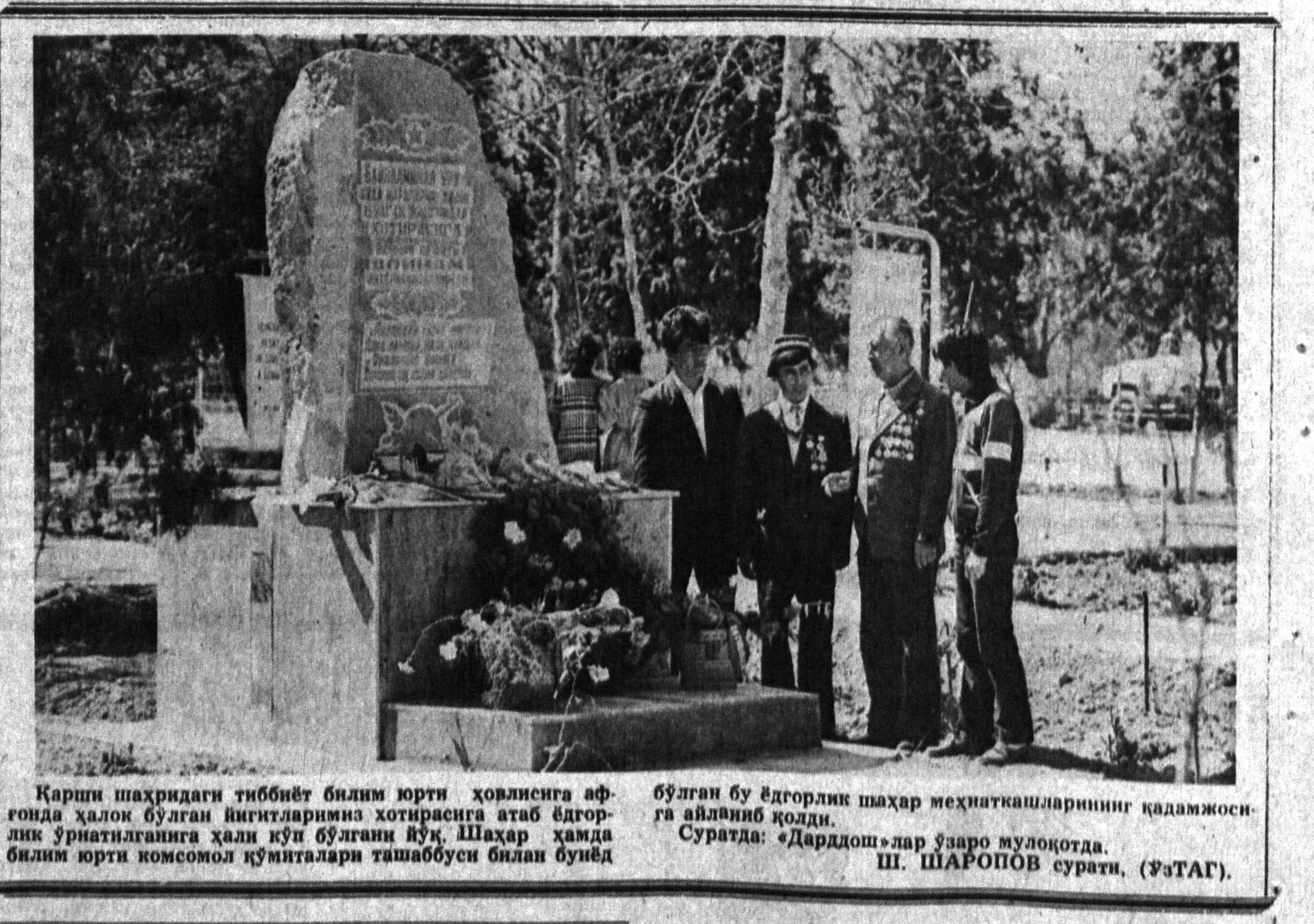
Қарши шаҳридаги табиий билим юрти ҳовилисига афғонда ҳалок бўлган йигитларнинг хотирасига атайб ёдғорлик ўрнатилган ҳали кўп бўлган йўқ. Шаҳар ҳамда билим юрти комсомол қўмиталари ташаббуси билан бунёд.

Совхоз чўлда жойлашган, унинг ҳудудида ҳатто барханлар ҳам бор. Езда жазирани иссиқ, тағнадек соя тополмасиз, йил бўйи шамол эсиб туради. Шу сабабли хўжаликда иҳота дарахтзорларини авужда келтиришга ва мезвора боғлар барпо этишга қарор қилинди. Бунинг учун Андижон вилоятидан марказлашган ҳолда кўчат сойти олишди ва иссиқ кунлар бошлангани билан бу кўчатларни барча хоҳловчиларга тегишга улаштириш. Энди барча ҳовилларда, ариқлар, йўллар ва далазларнинг ёқаларида дарахтлар пайдо бўлди. Ун тектар ерда эса совхоз боғи барпо этилди.