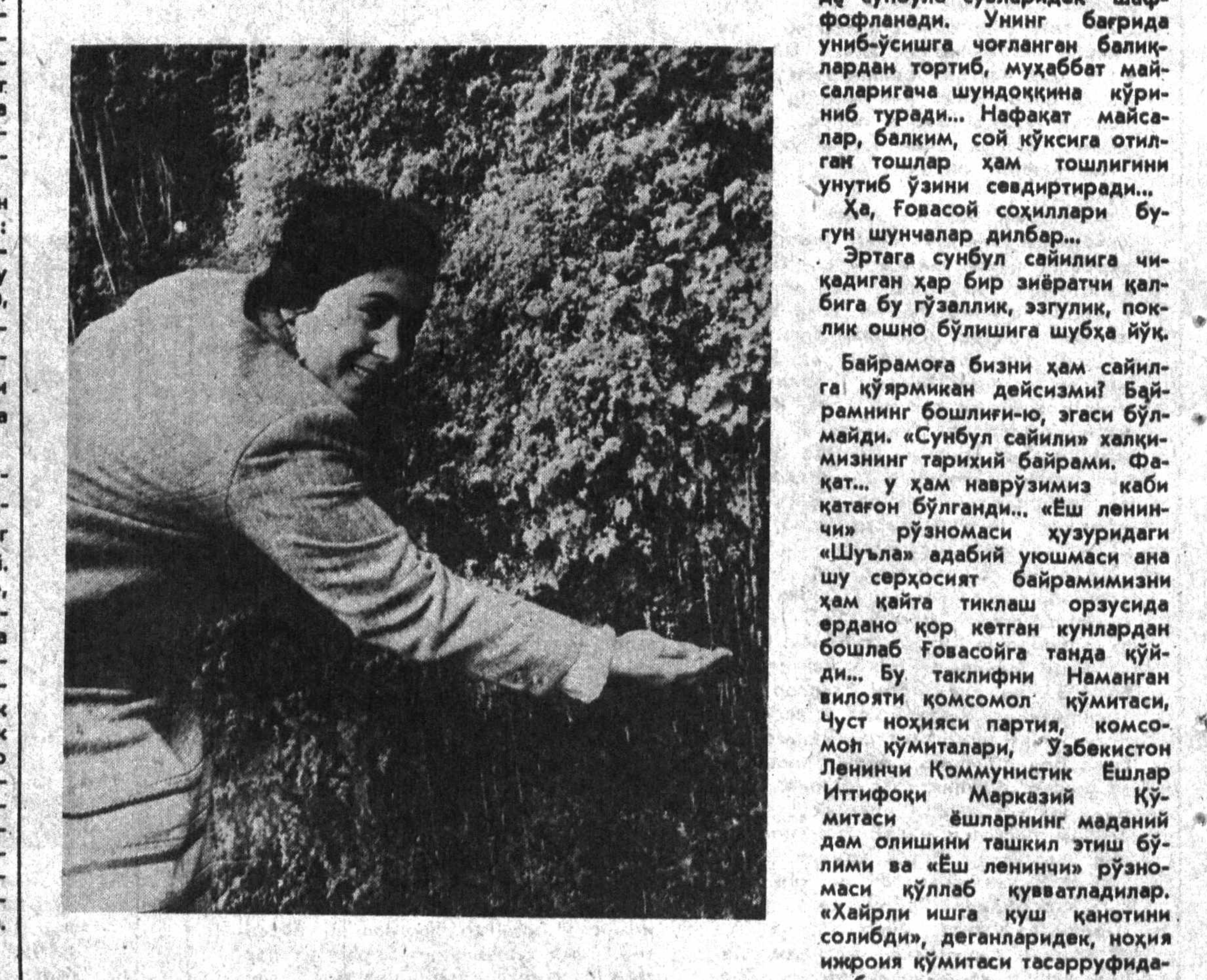
Юнинг суҳбати, муҳаббат, диққат, диққат, диққат!

Сочлари сунбул қизлари ўша сунбул сочларга умрини остиб яитдилар! Рўномамиз жарлаган сунбул байрамга боршини унутмадик! Ҳовасой соҳилларига йўлимизга тортулган сунбуллар ўзларининг тим қора сочларини патила-патила қилиб байрамга безанибди.