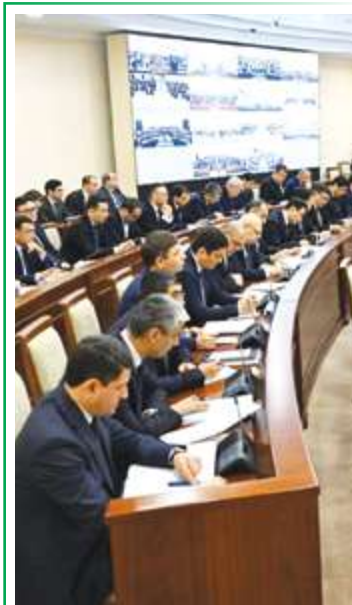
Президент Шавкат Мирзиёев раислигида 29 январь куни уй-жой ва коммунал хўжалиги, қурилиш, транспорт ва экология соҳаларидаги устувор вазифалар муҳокамаси юзасидан видеоселектор йиғилиши ўтказилди.