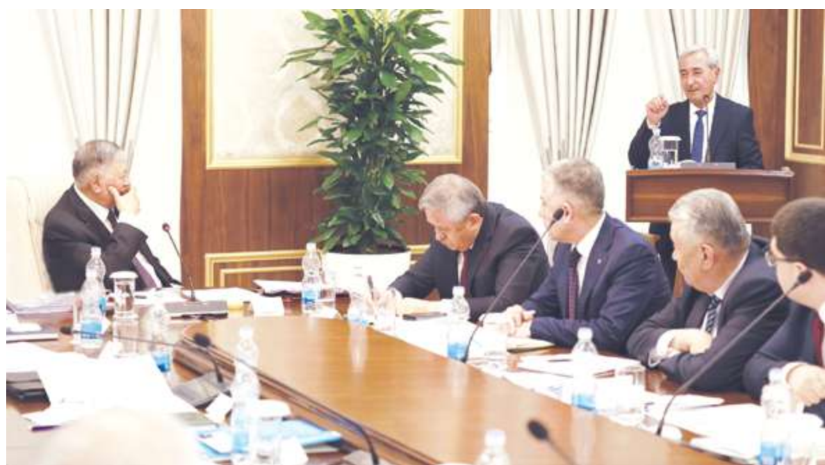
Ўзбекистон касба уюшмалари саройи мажлислар залида Касба уюшмалари Федерацияси Ижроия қўмитасининг йиғилиши бўлиб ўтди. Унда Ижроия қўмита аъзолари ҳамда мутасадди раҳбарлар иштирок этди.

Йиғилишда кун тартибидagi қатор масалалар юзасидан Ўзбекистон касба уюшмалари Федерацияси раиси Қудратилла Рафиқов ҳамда аппарат бўлим мудирлари, бошқарма бошлиқларнинг ахборот ва ҳисоботлари тингланди.