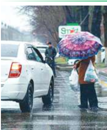
29 январь куни Тошкент шаҳри маҳалласидаги 1 кубометр ҳавода атиги 23 микрограммни ташкил этди.