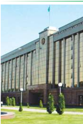
Ўзбекистон Республикаси Вазирлар Маҳкамасининг «Чорвачилик хўжалиқлари аҳорий давлатлардан импорт қилинган наслдор қорамол, қўй ва эчкилар учун субсидия ажратиш тартиби тўғрисидаги Низомни тасдиқлаш ҳақида»ги қарори қабул қилинди.