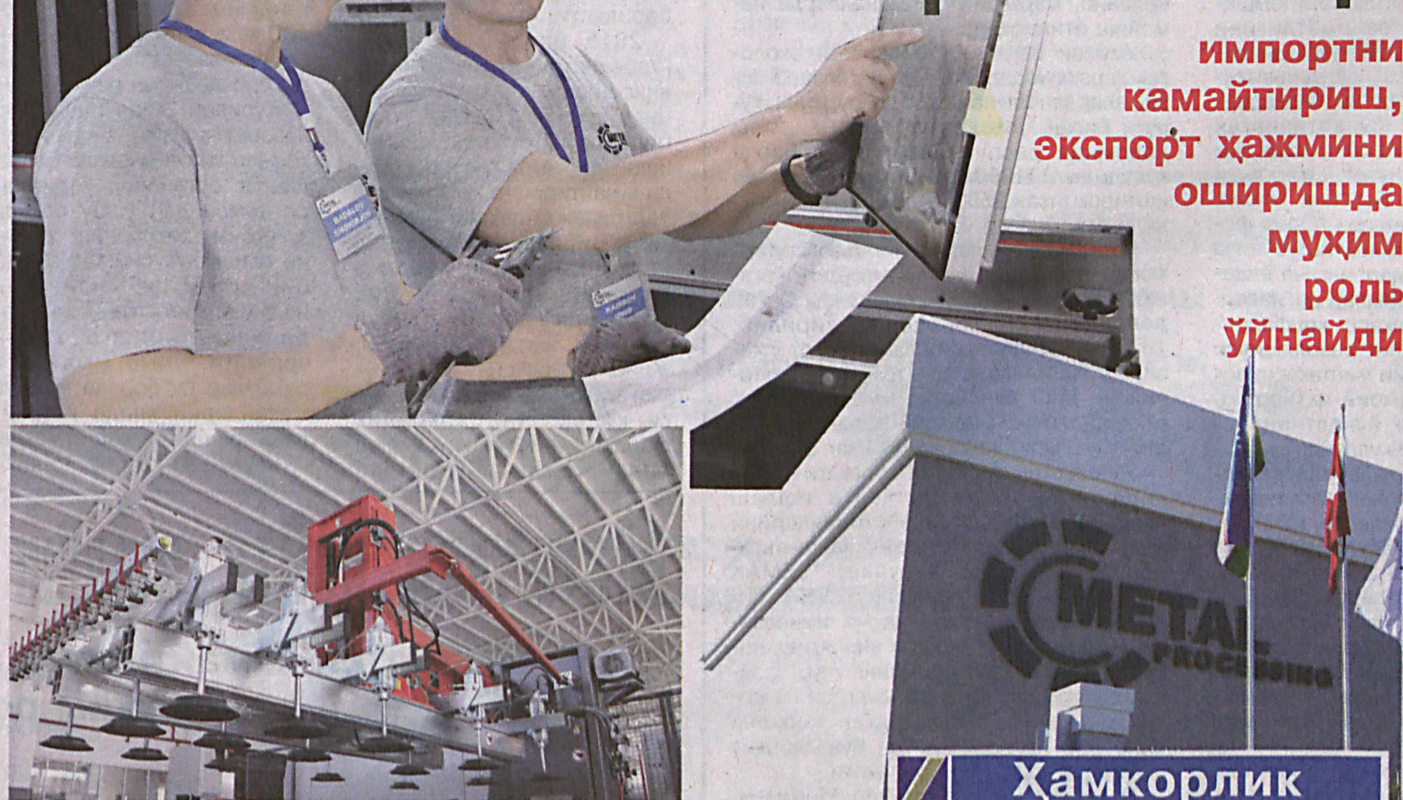
Тошкент шаҳрида "Metal Processing" масъулияти чекланган жамияти иш бошлади.

Инвесторларнинг эътироф этишича, мазкур йирик лойиҳа нафақат Ўзбекистон, балки Марказий Осиё металл қайта ишлаш саноати ривожига муҳим қадам бўлди. Зеро, минтақада ягона бўлган ушбу юқори технологияли завод тўқимачилик машинасозлиги учун халқаро стандартларга тўла жавоб берадиган ускуна