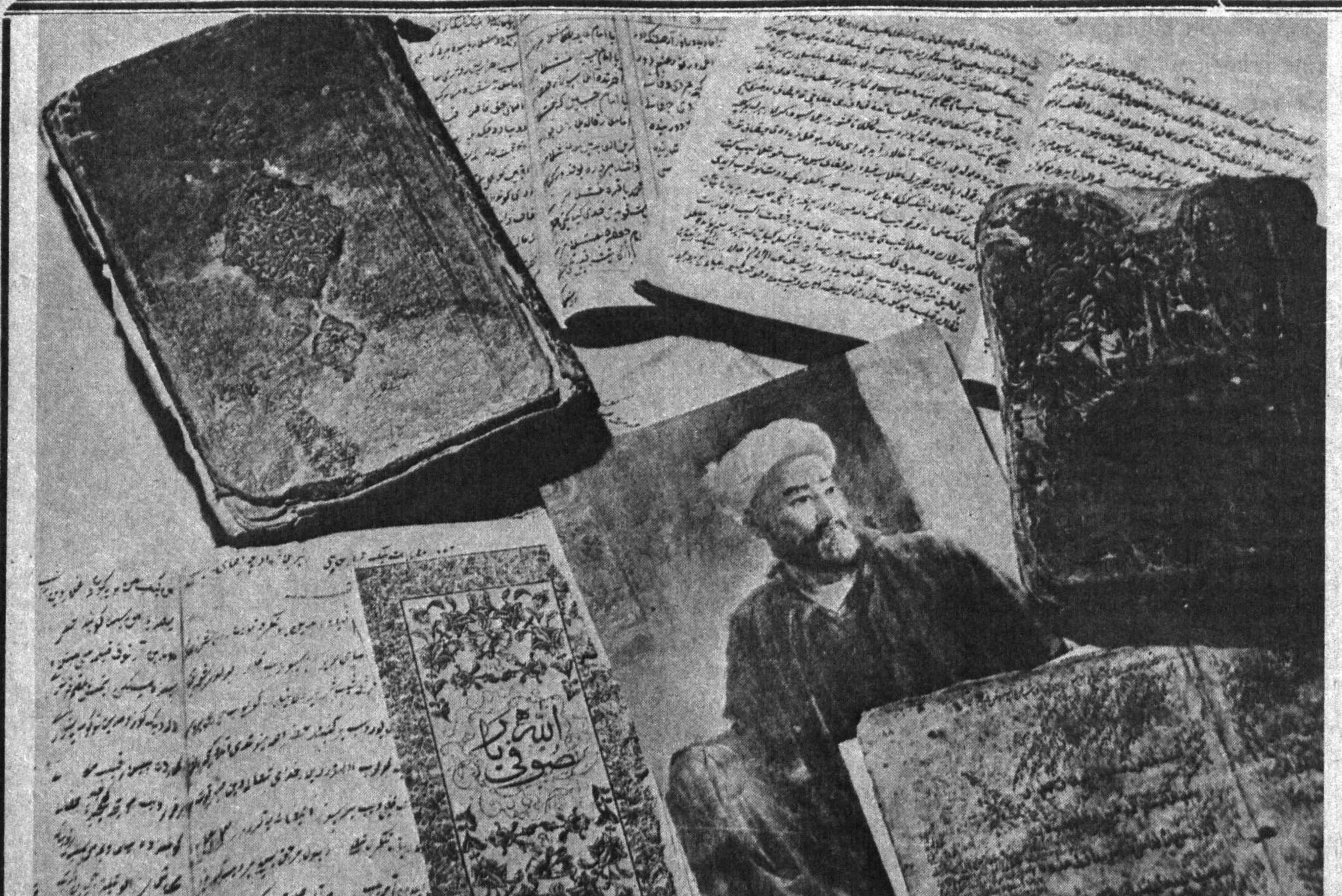
Маданиятнинг тарихининг ўлмас обидалари шўро ҳокимиятининг дастлабки йилларида оммавий суратда йўқ қилинган энди барчамизга аён. Бу офат улғу бобомис Алишер Навоийга ҳам четлаб ўтгани йўқ. Унинг ушбу нодир девони яқинда бузилган бир ўй девори орасидан топилди. Қайси бечора уни бу тахлит сақлаб қол-лишга жазм этган экан?

Шоир Музаффар Аҳмаднинг қафолат беришича анча озор топан бу девонда Навоийнинг шу кунгача эълон қилинган асарлари қирмаган ғазаллар мавжуд. СУРАТДА: аёй душманлари-хуруждан омон қолган девон саҳифалари.