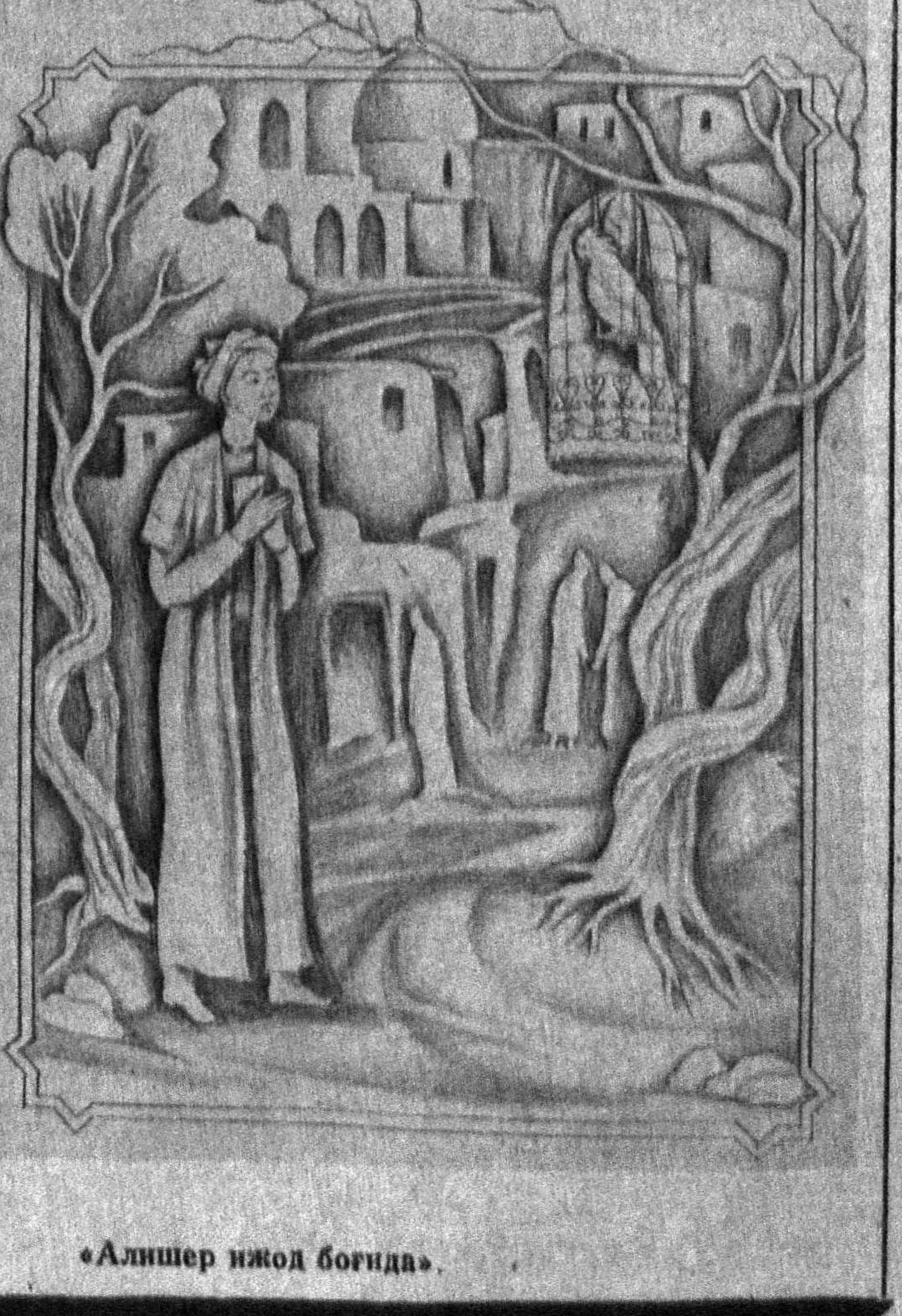
«Алишер яқод богнда».