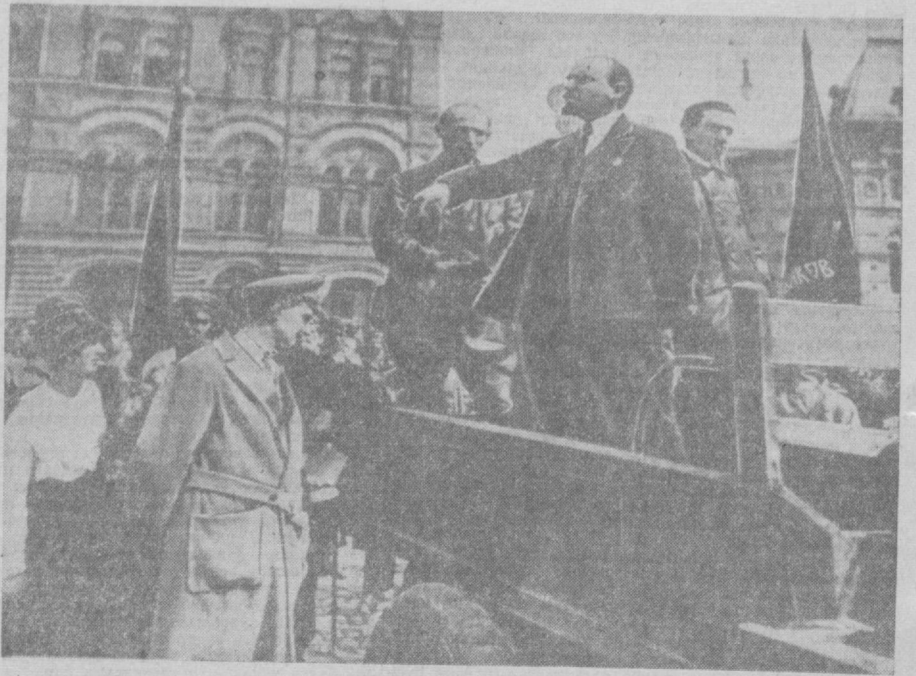
МОСКВА, Қизил майдон. 1919 йил 25 май. В. И. Ленин шаҳар меҳнаткашлари олди да нутқ сузламоқда.