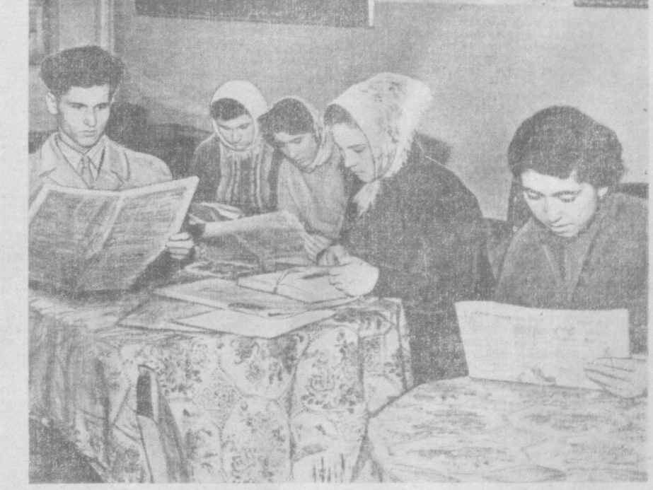
Тошкент шаҳар Ленин районидagi 15-агитпункт доимо одамлар билан гажжум. Агитпунктда СССР Олий Советига сайловлар олдидан қизғин тайёргарлик қилиниб, навбати агитаторлар тайинланган. Бу ерда сайловчилар бўш вақтларини кўпгилди ўтказмоқдалар. Суратда: агит. А. Паахов фотоси.