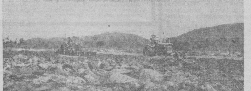
Африка. Марказий Африка республикасининг хукумати қишлоқ хўжалигига катта эътибор берапти. Деҳқонлар техника, уруғ ва ўғитлар билан таъминлаб турилади. Суратда: Банги қишлоғида ер ҳайдаш пайти. Б. Федоров фотоси. (ТАСС).

хукумати қишлоқ хўжалигига катта эътибор берапти. Деҳқонлар техника, уруғ ва ўғитлар билан таъминлаб турилади. Суратда: Банги қишлоғида ер ҳайдаш пайти. Б. Федоров фотоси. (ТАСС).