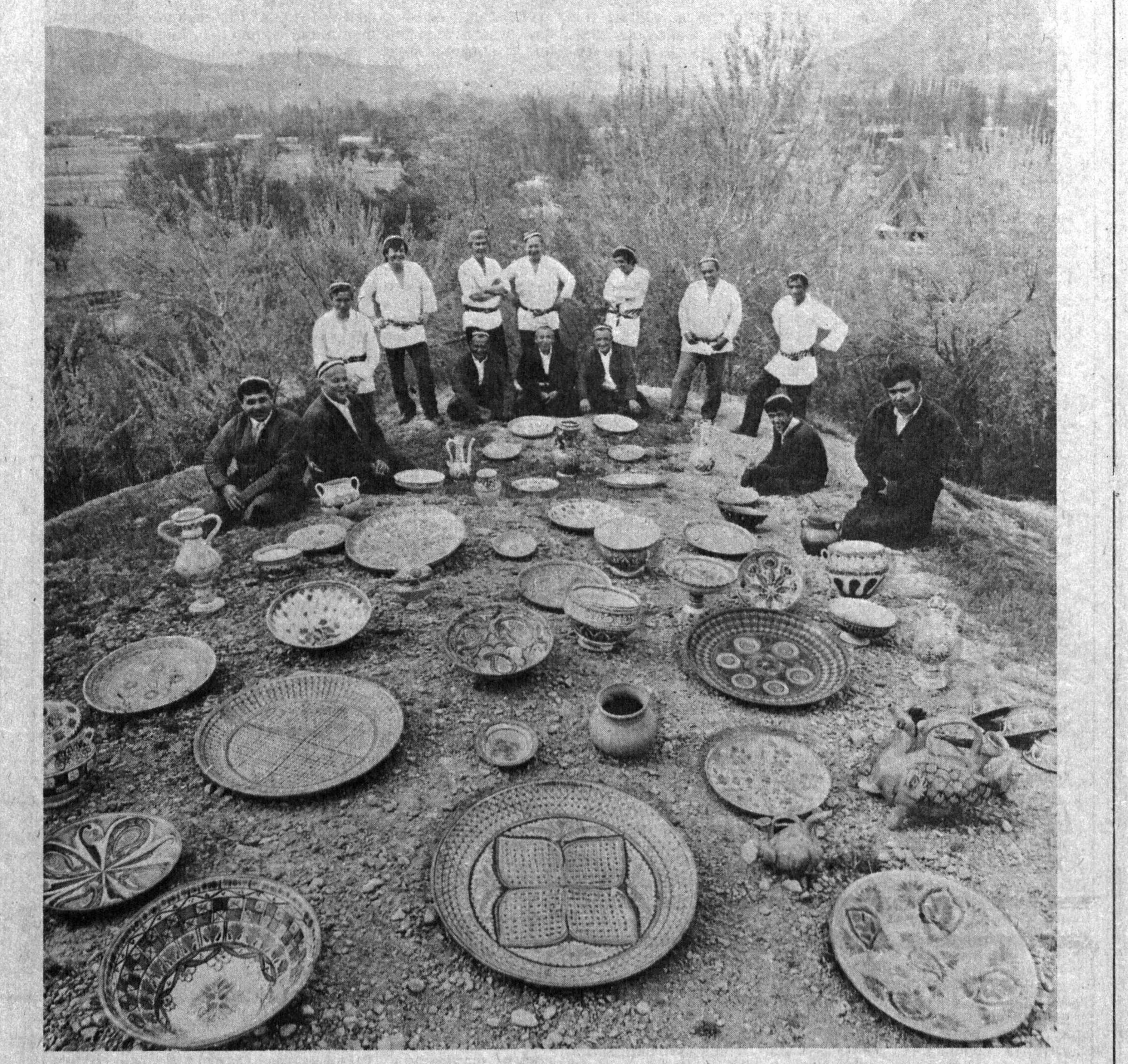
Риштон қуллоллари.