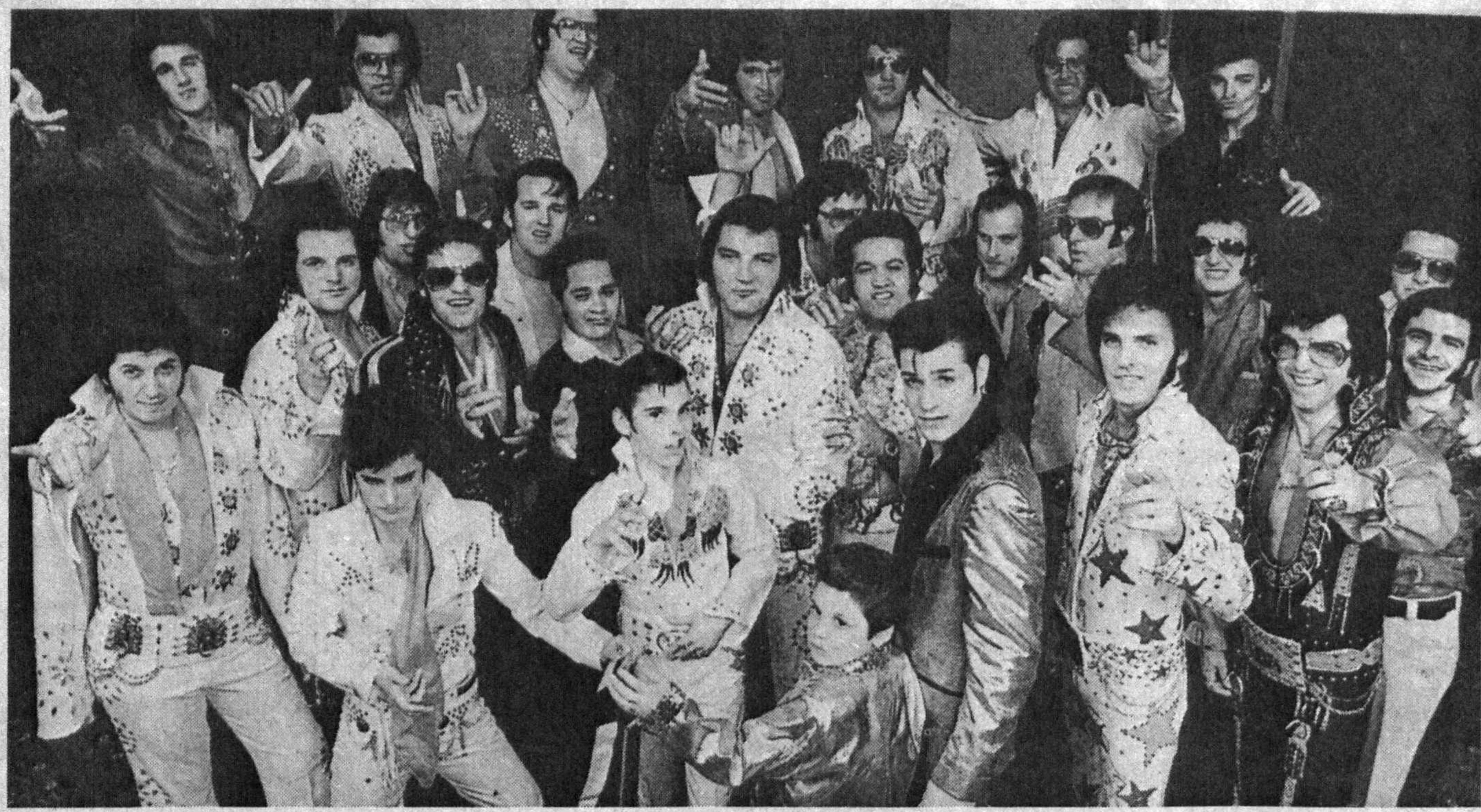
Машҳур гўшқичларнинг тақдирчилари, бошқачароқ қилиб айтганда «сон»лари кўп бўлади. Яқинда Чикагода таниқли ҳофиз ва бастакор Элвис Преслининг дувбади шоғирдари йўқлашди. Бу Халқаро учрашува келганлар.