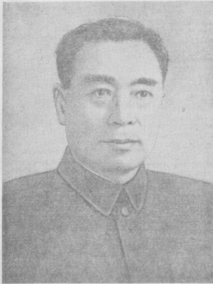
Хитой Халқ Республикаси Давлат кенгашининг Бош Министри Чжоу Энь-лай.