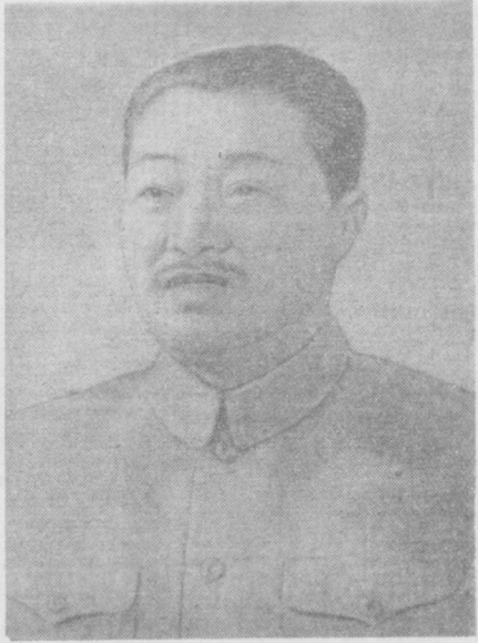
Хитой Халқ Республикаси Давлат кенгаши Бош Министрининг ўринбосари Хэ Лун.