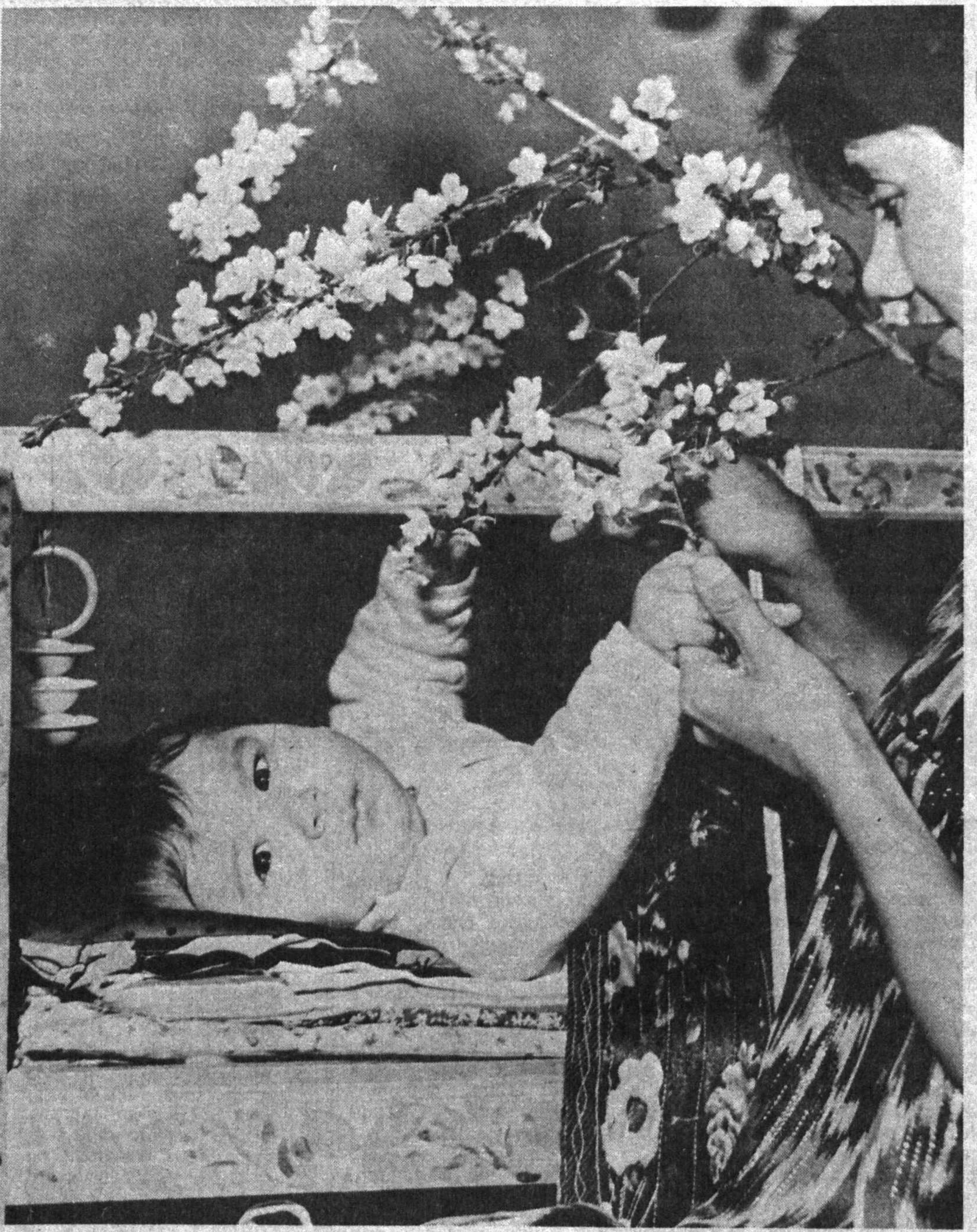
БЕШИК БОЛАНИ, БОЛА ДУНЕНИ ТЕБРАТАР...

«Еш ленинчи» рўномаси ҳузурдаги «Шуъла» адабий уюшмасининг навбатдаги машғулотини шу йил 3 март якшанба кунин соат 13.30 да жумҳурият ёшларининг «Илҳом» клубида ўтказилади. Унда «Наврўз» айёмига тайёргарлик масалаларни кўрилади. Ушунга аъзоларини ва барча қизиққанларини тақдиф этишимиз.