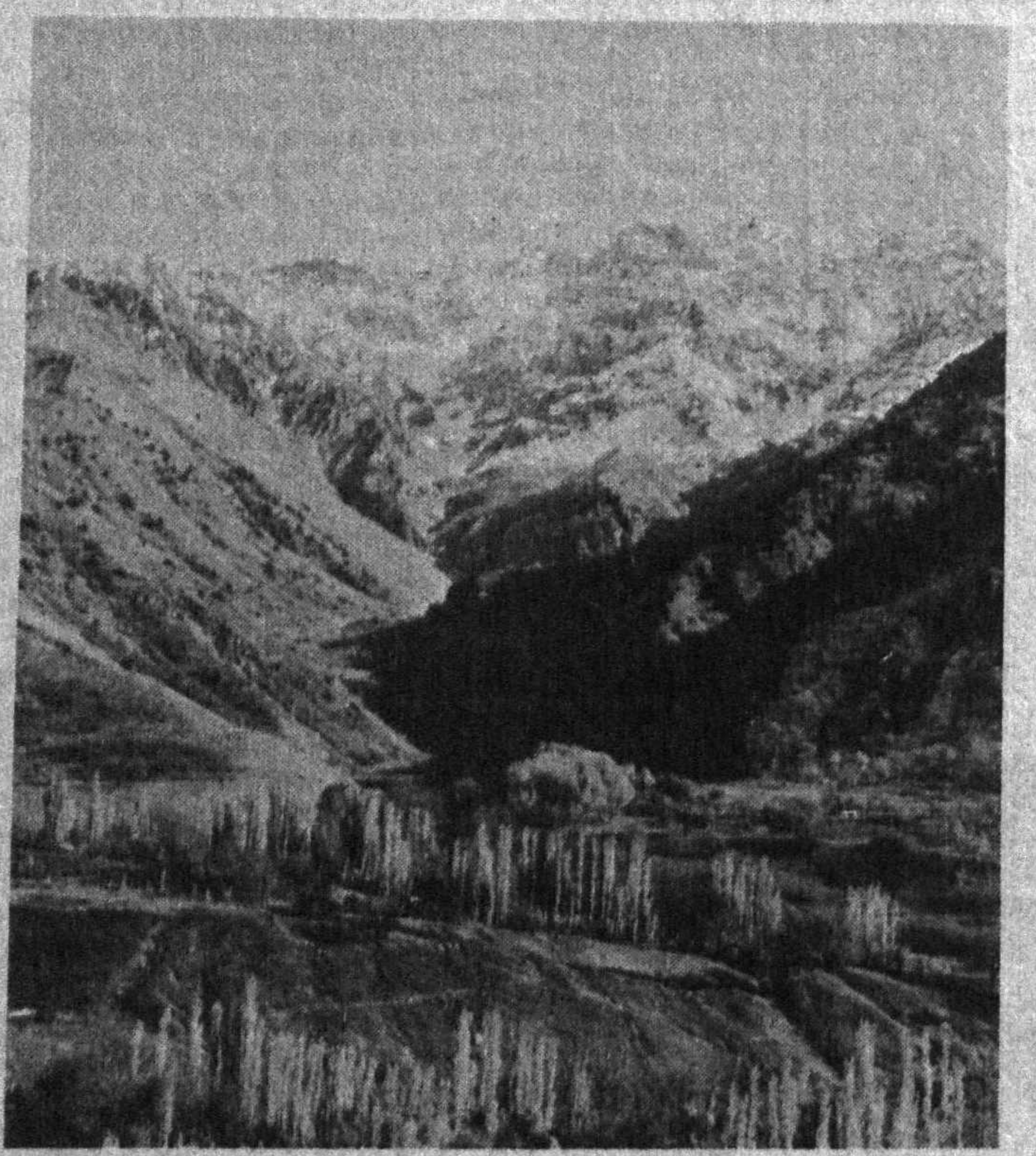
Эҳ, сиз тоғлар, дилрабо тоғлар, Еш қалбимни мафтун этгансиз. Ешлик, бахтни куйлагини дея Ижодингга илҳом тутгансиз.

Мана, бугун наврўзи олам, Дўстларимга гуллар тутарман. Қайлардасан, севгили эркам... Қўлимда гул, сени кутарман, Умрим бўйи чорлаб ўтарман; — Сен бахорни соғинмадингми?