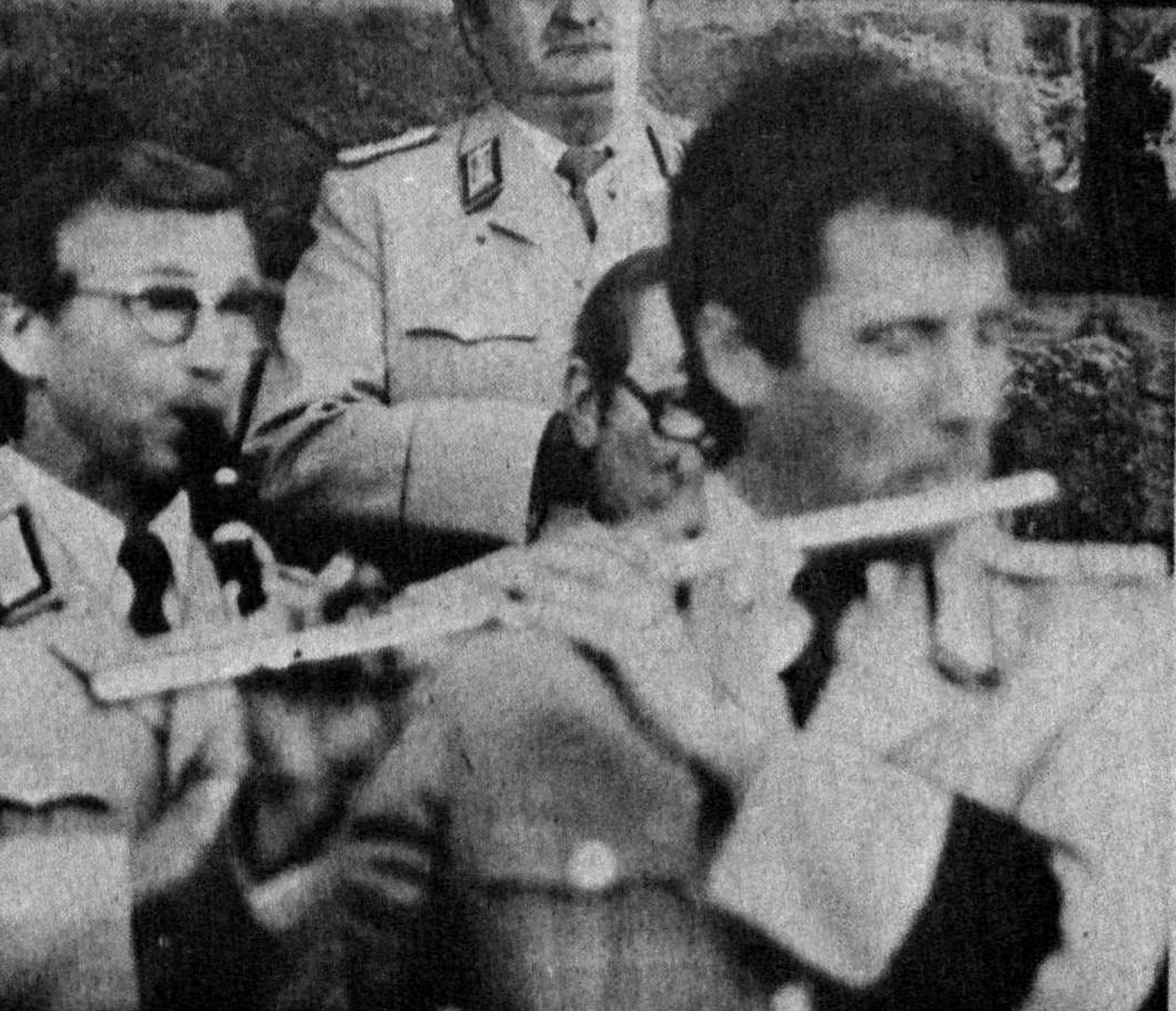
Суратда: Берлин полицияси мунгли оркестр мусикалари остида қасаба уюшмаси митингини кузатиб бормоқда. Ана шу мусиқа жамоаси маблағ ажратилиши тўхтатилиши мубосабати билан берлинликлар ўртасида яқин кунларда ўз оммавийлигини йўқотади.