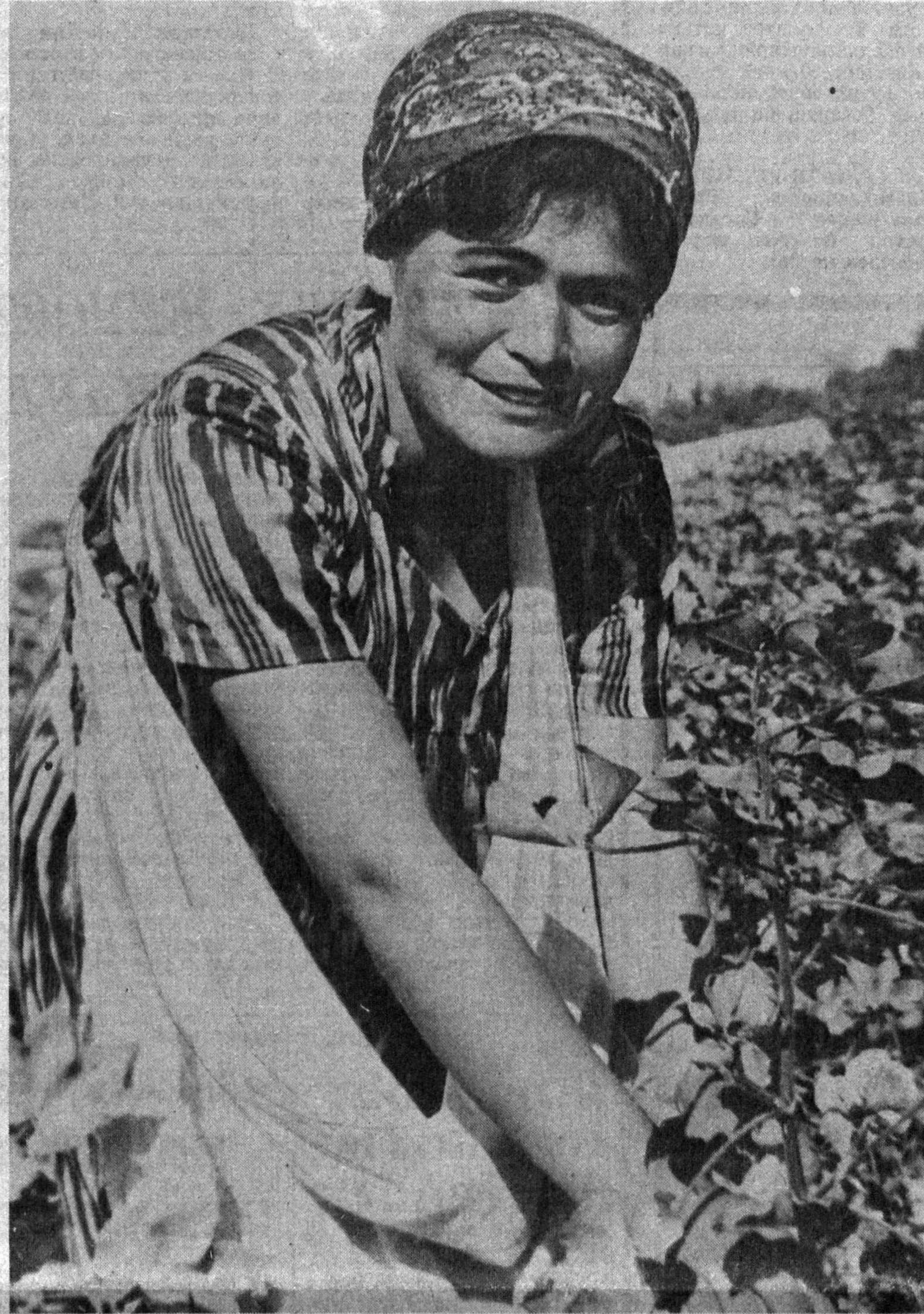
Машина зўрни ё кўл кучи? Ҳозирча чевар қилармиш «пўлат от»лардан зўр чиқаришди. Ана, Матлубанинг бир ўзи шу кунгача тўрт тонналик хирмон ўйди. У Бухоро вилоятининг Қивайтепа ноҳиясидаги «Еш ленинчи» жамоа хўжалиги далаларида тонларни тунга улапти.

Бўлим деҳқонлари яна 122 тонна пахтани йиғиб-териб олиб, хирмонни 805 тоннага етказишмоқчи.