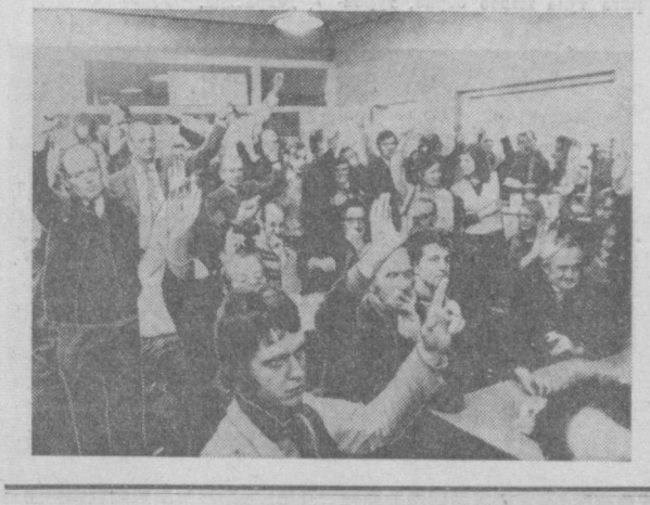
ГОЛЛАНДИЯ. Эйдховен шаҳридаги «Кезпенланд» кон-кдитер фабрикасининг 200 илчиси қорхона ҳўжайинининг фабрикада «Манеба» конференцияга еттиш ҳақидаги қарорига қарши норозилик намойиши билан чикди. Фабрика дирек-тисини намойишчиларга ён бо-сишга ва уларнинг талабларини қондиришга мажбур бўлди. Ишчиларини уч йил мобайнида мустанд меҳнат ва аяин ми-ош билан таъминлашга ваъда берди. Суратда: намойишчилар-дан бир гуьраси.