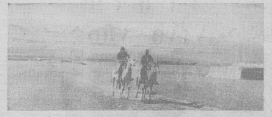
Шу йилнинг июль-август ойларида деңиз сатҳидан 3800 метр баяндадиган Аччиқтошда «Помир-74» халқаро альпинистлар лагери барпо этилди. Шу ерда турли мамлакатлардан келган спортчилар энг баянда чуққиларга ҳужум қилишади. Суратда: Олой водисидан Ленин чуққисининг умумий