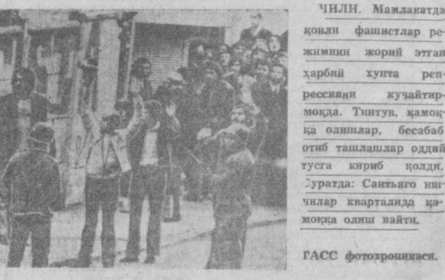
ЧИЛИ. Мамлакатда қозил фашистлар режимини жорий этган ҳарбий хуфта репрессияни қучайтормоқда. Тинтув, қамонда олишлар, бесабаб отиб ташлашлар оқдий тизим қизқини бўлди. Урагда: Сантьяго ишчилар кварталда қамонда олиш вағиз.

АММОН, 15 январь (ТАСС). Исроил маъмурилари Иордан дарёсининг қароли соҳидаги илдиб қизқини араб аҳолиси ўртасида яна қамонда олиларини бошлаб қизқини. «Ар-Бей» газетасининг хабар беришича, Қуддус, Наблус, Салвад шаҳарларинида босқинчилар маъмуриятини қаролини кўрсатиб, Исроил қорқоналаринида илдишдан бош тортган қўл араблар қамонда олинди. Исроилликлар қаролини кўрсатиш ҳаракати билан алоҳида қизқинида гумондордир, деб ҳисобланган арабларнинг уйлари хамма портлатмоқдалар.