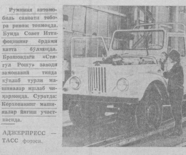
Руминия автомобил саноати тобора ривож топишмоқда. Буца Совет Иттифоқининг ёрдами катта бўлмоқда.

Унинг сўқлаб қолиш йўлларини назорат қилиш. Партизанларнинг хабарларидан ва ўзига олинган немис ҳужжатларидан маълум бўлишича, Власов 1942 йилининг 13 июлида Ялтада қишлоқда немис солдатларининг пайдо бўлишини хотирламни билан кутиб турган ва улар келиши билан «Отманлар, мен — генерал Власовман», деб гитлерчилар томонига ўтиб кетди. Уша кунни унинг 18-армия қўмондонини генерал Линдеманн ҳузурига элтирдилар. Фактлар ана шундай.