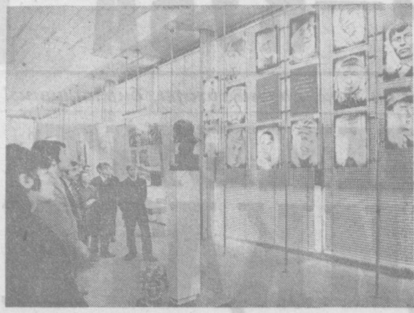
Суратда: Виставка залида.

Томошабилардан Фарғона область Ленинград районидан Ҳамза номли совхоз сувчиси Муҳаммадхон Юсуфов ҳам виставка экспонатларини қизиқти билан кўздан кечириб чиқарди шундай дейди: — Иноқ бўлиб қолоқ ўлкада социализм қурдик, Европани