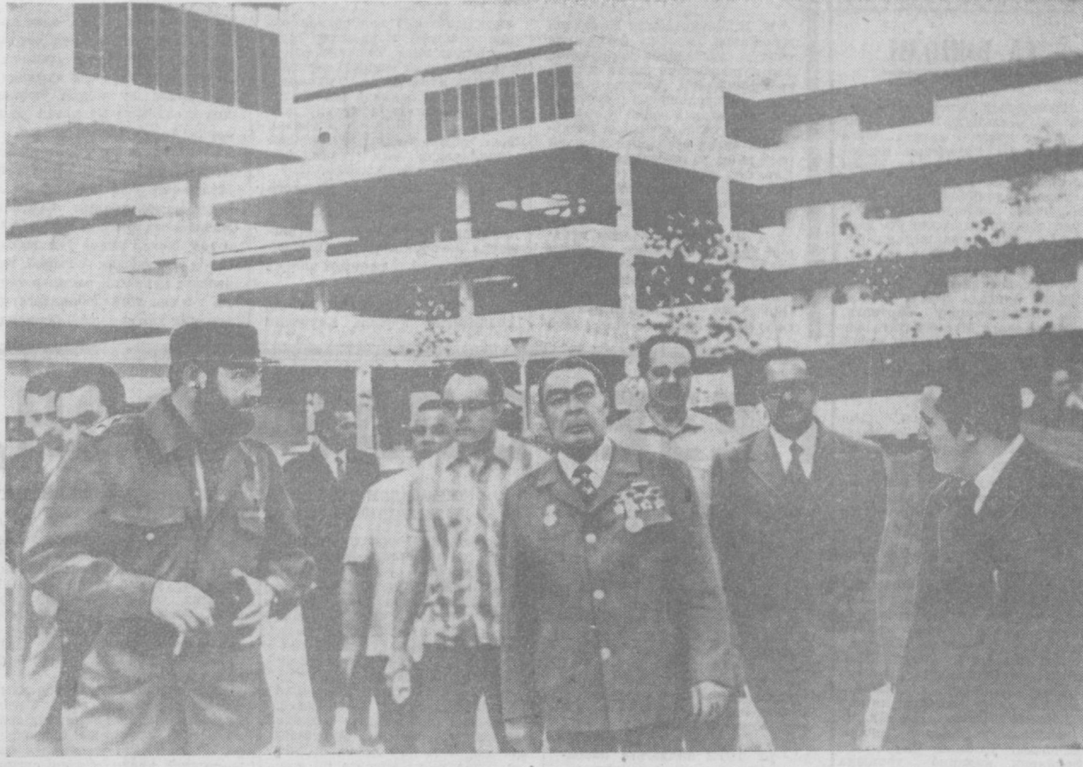
Л. И. Брежнев ва Фидель Кастро ўртоқлар интернат-мактабни очиб маросимда.

Галабаларини кўпайтирдилар, деб ишонамиз. Аниқ дўстлар, халқ маорифи каби катта ва олийжаноб ишда улкан муваффақиятларга эришувингизни чин қўнғидан тилаймиз. Мактаб биноси қуриб чиқилганидан кейин асосий корпус олдида мактабни тантанали очиб маросими бўлди.