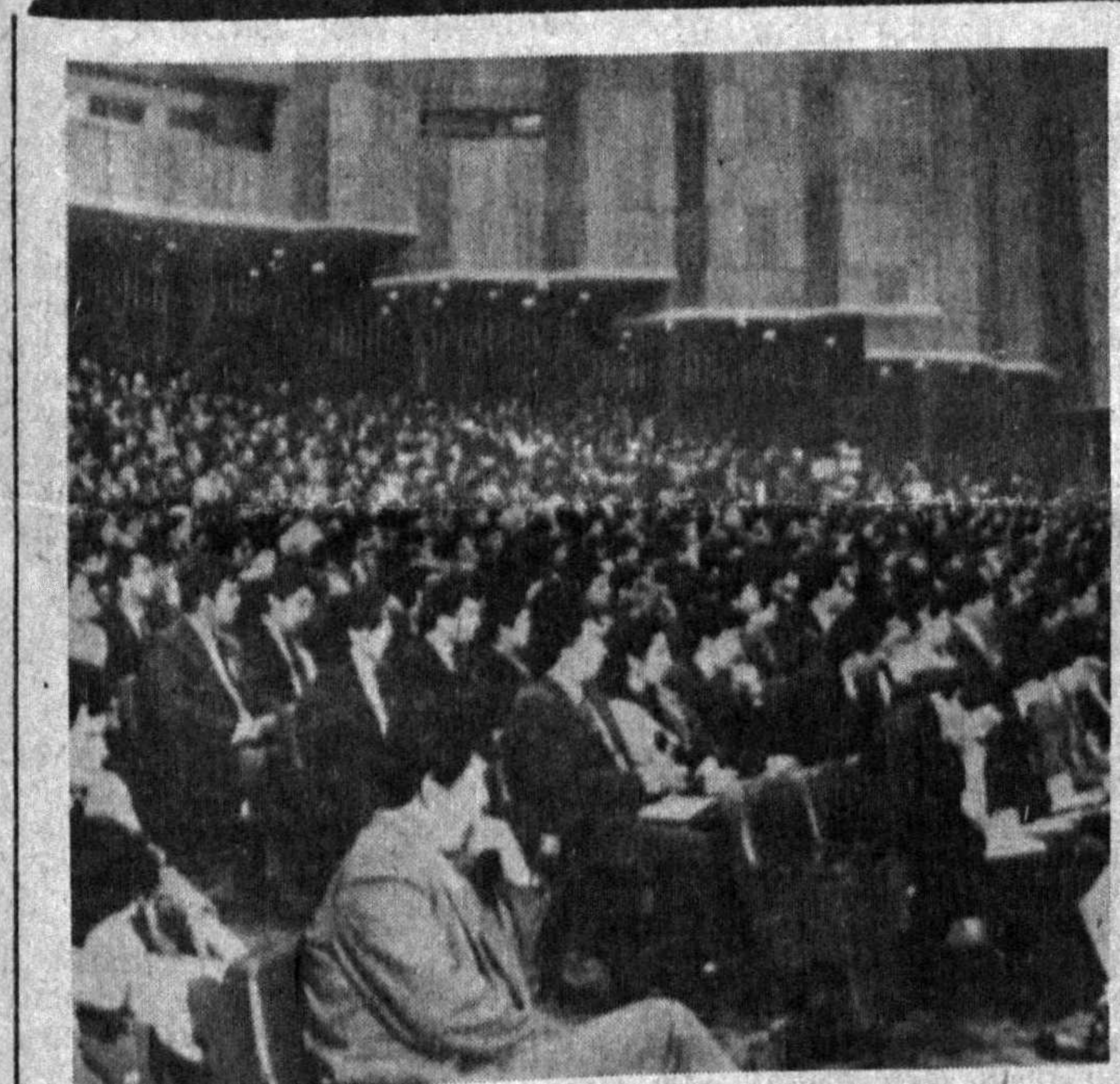
Ўзбекистон ЛКЎИ XXIV съездида.