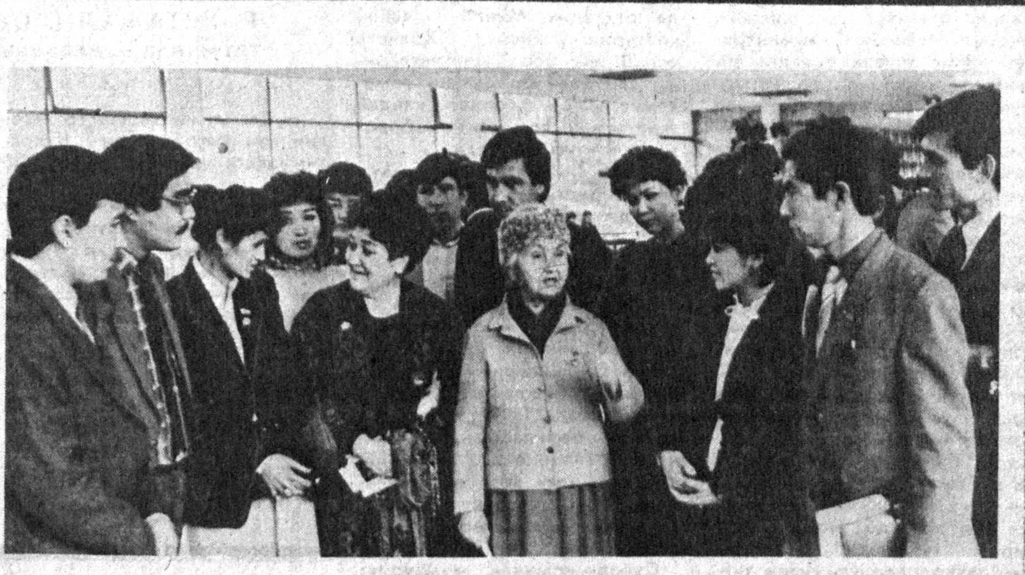
СҲРАТЛАРДА: съезддан лавқалар.

1950-йил 2 декабрда Ўзбекистон ССЖнинг Самарқанд шаҳрида туғилган. Ўзбек, маълумоти олий. 1972-йилда Навоий номидаги Самарқанд Давлат дорилфунунини тугатган. Ўзбекистон ССЖ Олий Кенгашининг депутати, Ўзбекистон Компартияси Марказий Қўмитасининг аъзоси, БЛКҲИ Марказий Қўмитаси Бюросининг аъзоси. 1987-йилда Навоий номидаги Самарқанд Давлат дорилфунунига ўқишга кирган. Дорилфунунни тугатгач, лаборант, кимё технологияси кафедрасининг ўқитувчиси бўлиб ишлаган. 1973-йилдан бери комсомол ишида: Самарқанд шаҳар комсомол қўмитасида йуриччи, Самарқанд вилоят комсомол қўмитасида йуриччи, бўлим мудири, котиби, биринчи котиби вазифаларда ишлаган. 1985-йилдан 1987-йилгача Ўзбекистон Компартияси Самарқанд шаҳар Боғишамол ноҳия қўмитасининг биринчи котиби бўлган. 1987-йил февралда Ўзбекистон ЛКҲИ Марказий Қўмитасининг биринчи котиби этиб сайланган. Ўзбекистон ЛКҲИнинг XXIV съездида яна Ўзбекистон ЛКҲИ Марказий Қўмитасининг биринчи котиби этиб сайланди.