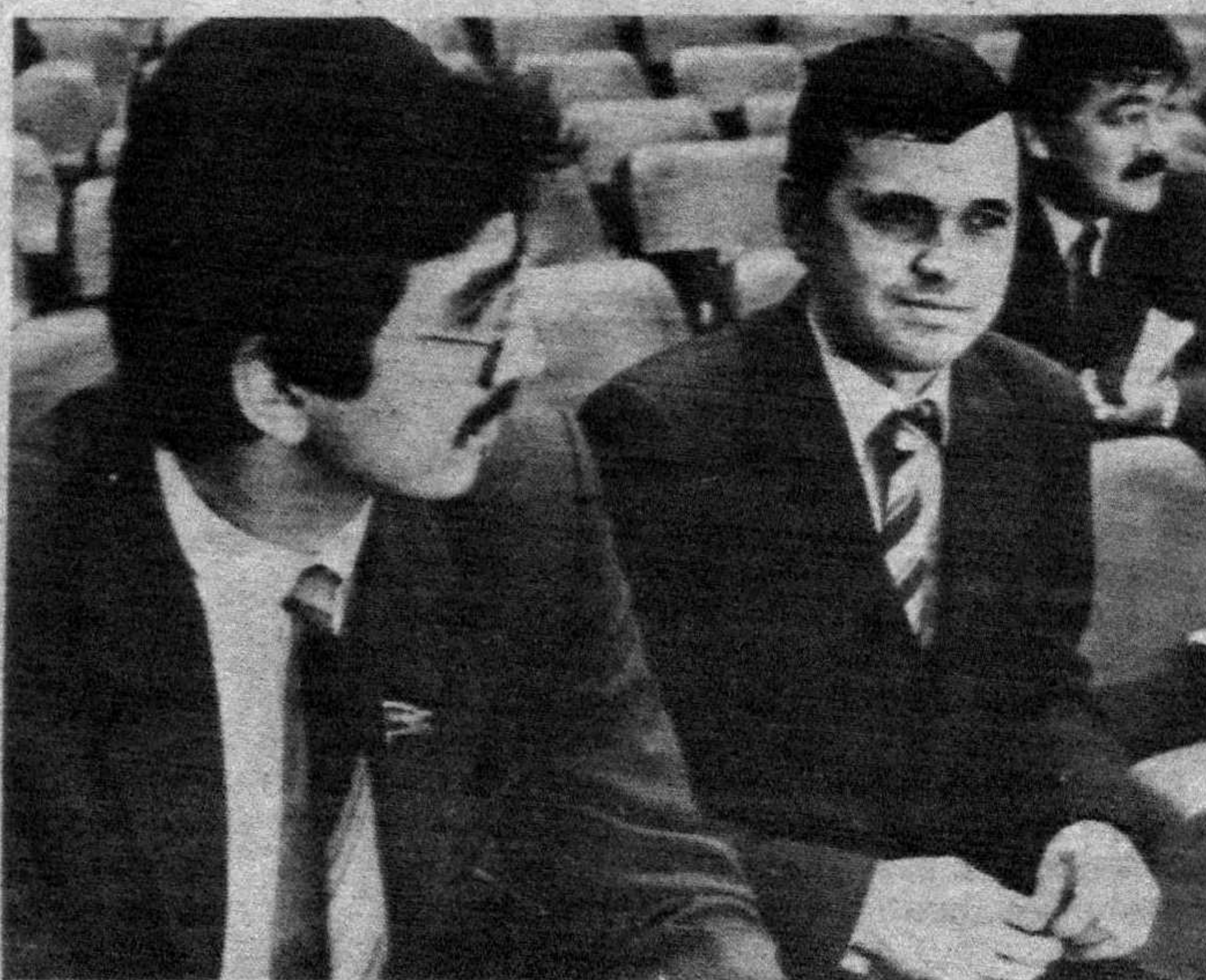
СУРАТЛАРДА: съезддан лавҳалар.

Делегатларчи? Ҳойнаҳой, ўтирсанг чўкиб кетадиган ором курсиларига қўлайроқ жойлашиб, ўйлашгандир: «Ниҳоят иссиқ ўрнимни топдим». Нимаям дердик, уларнинг «ишларига» ҳаёлан муваффақият тилаб қоламиз.