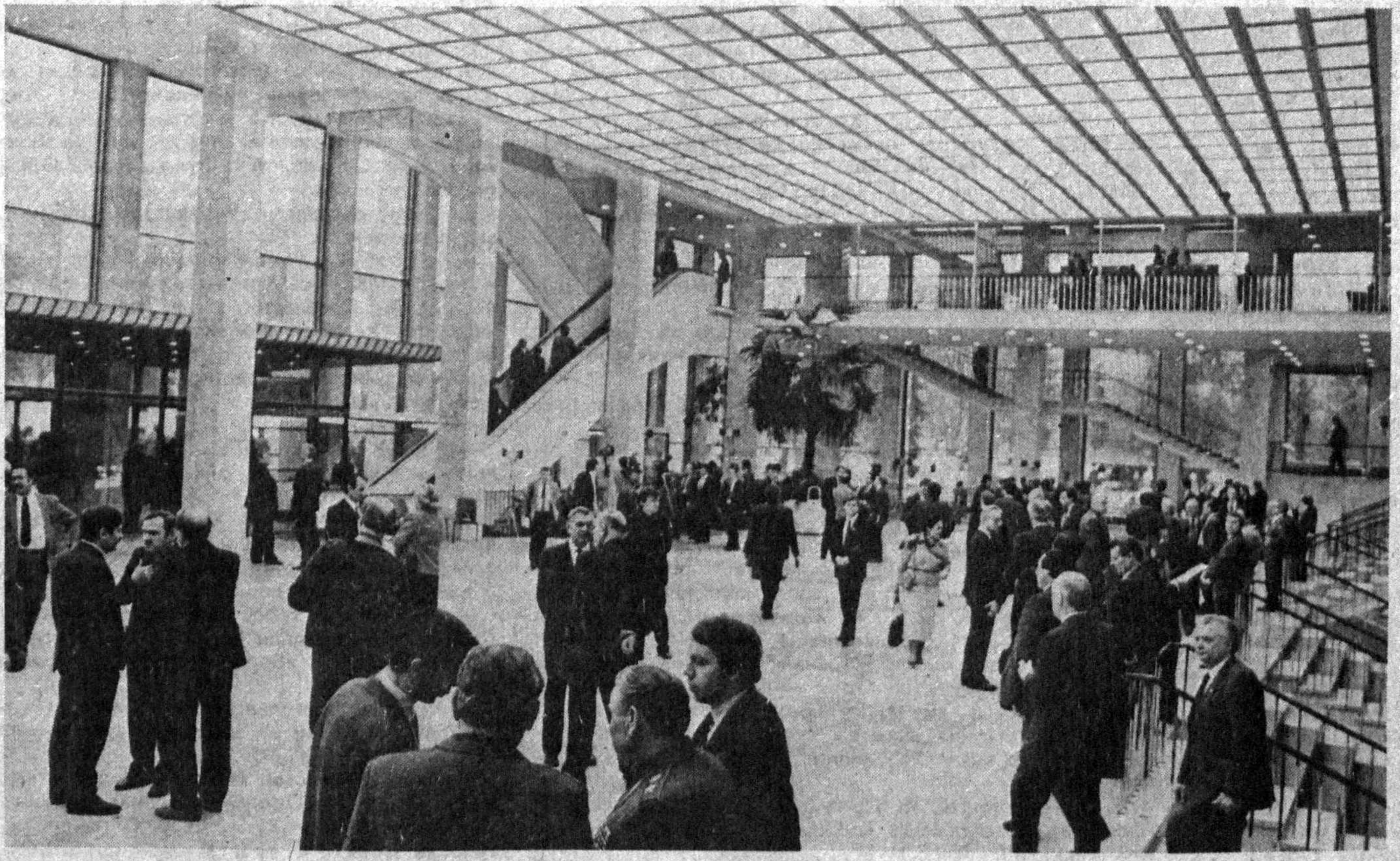
Москва, Кремль. Съездлар саройи. Съезднинг ҳатто танлаффуси ҳам баҳсларга бой ўтмоқда.