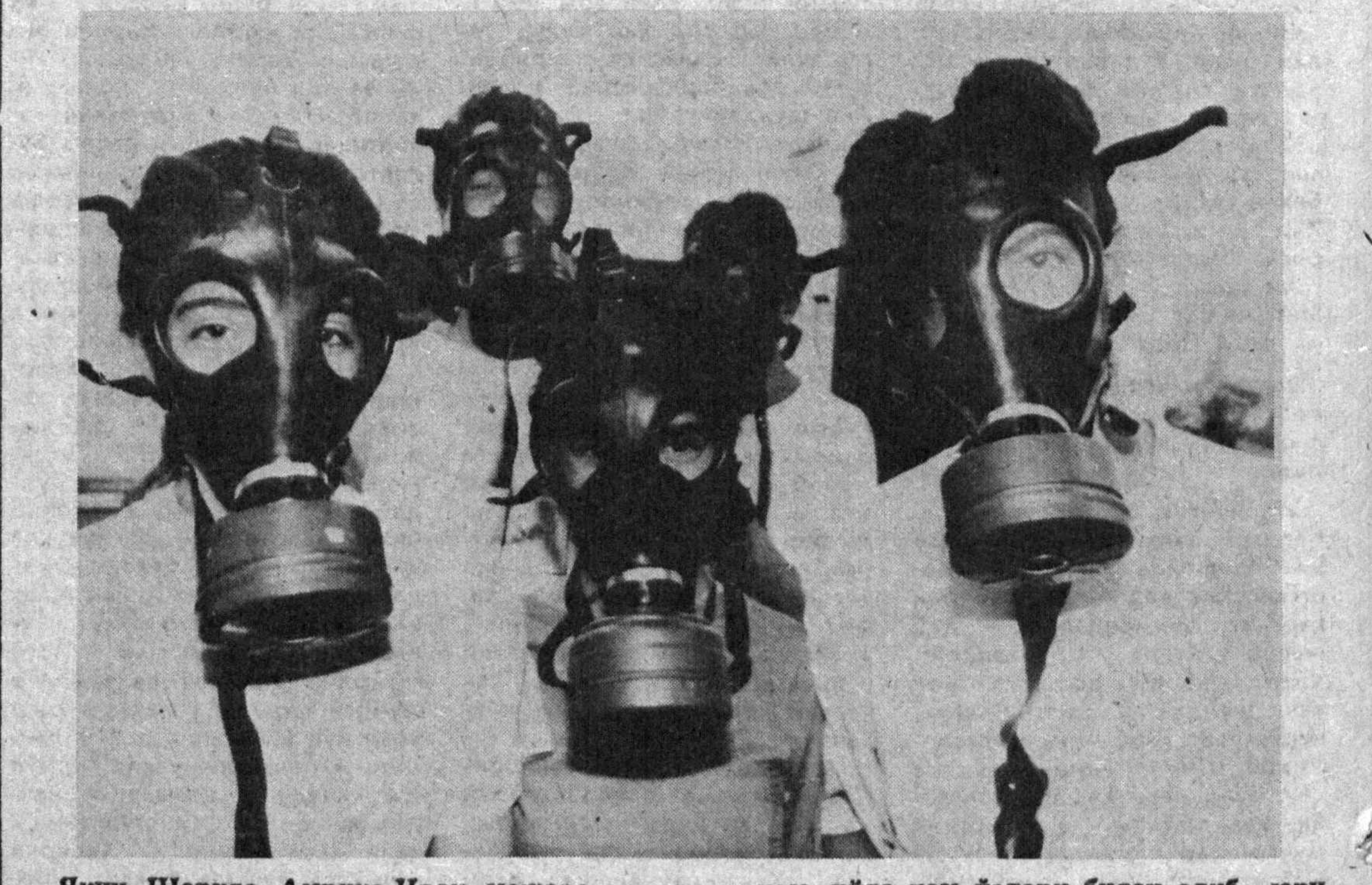
Яқин Шарқда Амрико-Ироқ можаро-лари авж олган сайн Исроил аҳолиси орасида саросималик кучаймоқда. Мана бир неча ойдерки Тель-Авив ва бошқа шаҳарларда противогазлар харидорлар томонидан қўлаб сотиб олинмоқда. Ҳатто одамлар противогазларни ишда ҳам, уйда ҳам ўзлари билан олиб юри-шади. СУРАТДА: Тель-аввалик ўқувчилар ўқитувчиларини шундай қарин олин-моқда.

● БРАЗИЛИЯ. «Фолья ди Сан-Пауло» рўномаси Бразилияда болалар ўлими билан боғлиқ муҳим маъ-лумотларни эълон қилди. Рўнома олинган расмий маълумотларга таяниб, Бра-зилияда ҳар кун 4 ёшгача бўлган минг нафар бола ва-фот этаётганлигини хабар қилди. Турилган ҳар минг чақалоқнинг 85 нафари чо-рочор кун кечираётган кам-бағал оилаларга тўғри не-лади. Улар ҳар қандай ти-бий хизматдан маҳрум ва оғирда 5 ёшгача ҳам яша-майди. Вужудга келган ва-зиятни ўзгартириш учун, деб эълон рўномаси, бутун жа-мият ириланиб қатъий ҳара-кат қилмоғи зарур. Хуку-мат аҳолининг камбағал та-бақаларини иқтисодий жи-ҳатдан муҳофаза этишга ан-ча кўпроқ маблағ ажратиб, дархол давлат бюджетига ўзгартишлар киритиши ло-зим, деб ҳисоблайди рўно-ма.