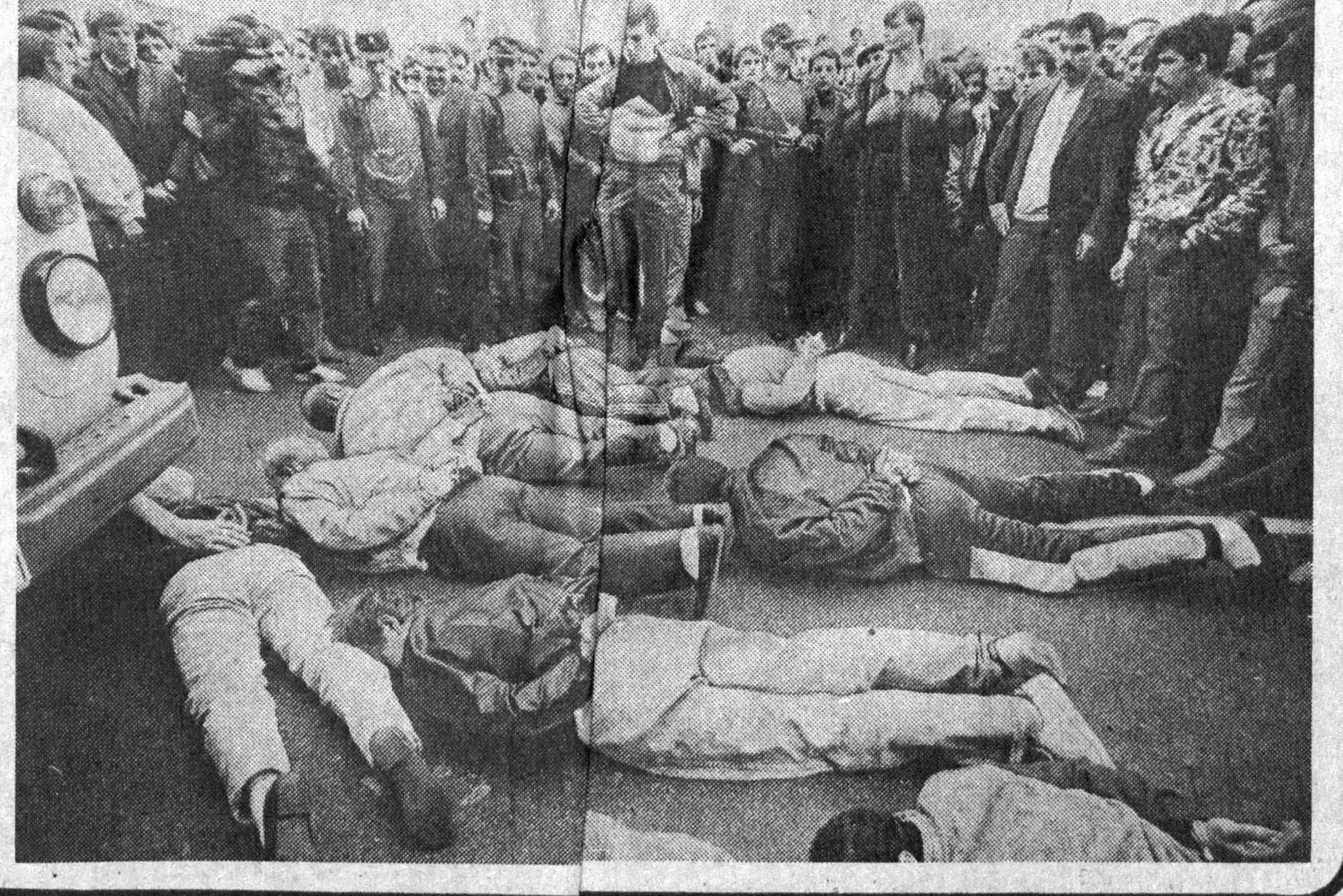
Дўкон ёнида автомобил қисмларини сотаётган рэкэтичлар гуруҳи қўлга олинди. Уларни гувоҳлар олдида тинтув қилиш учун ерга юзтубан ётқизишди. Бунинг қарангки, балогат ёшига етмаган...