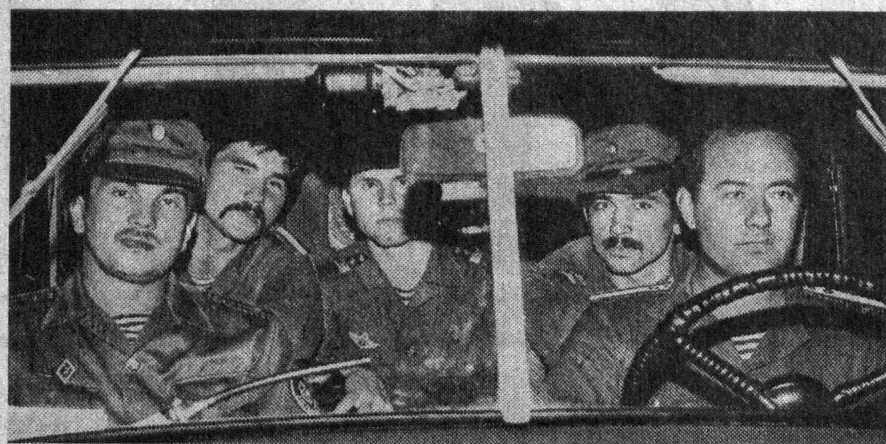
ЎЎИРЛИК НОНИ ТИШ СИДИРАДИ