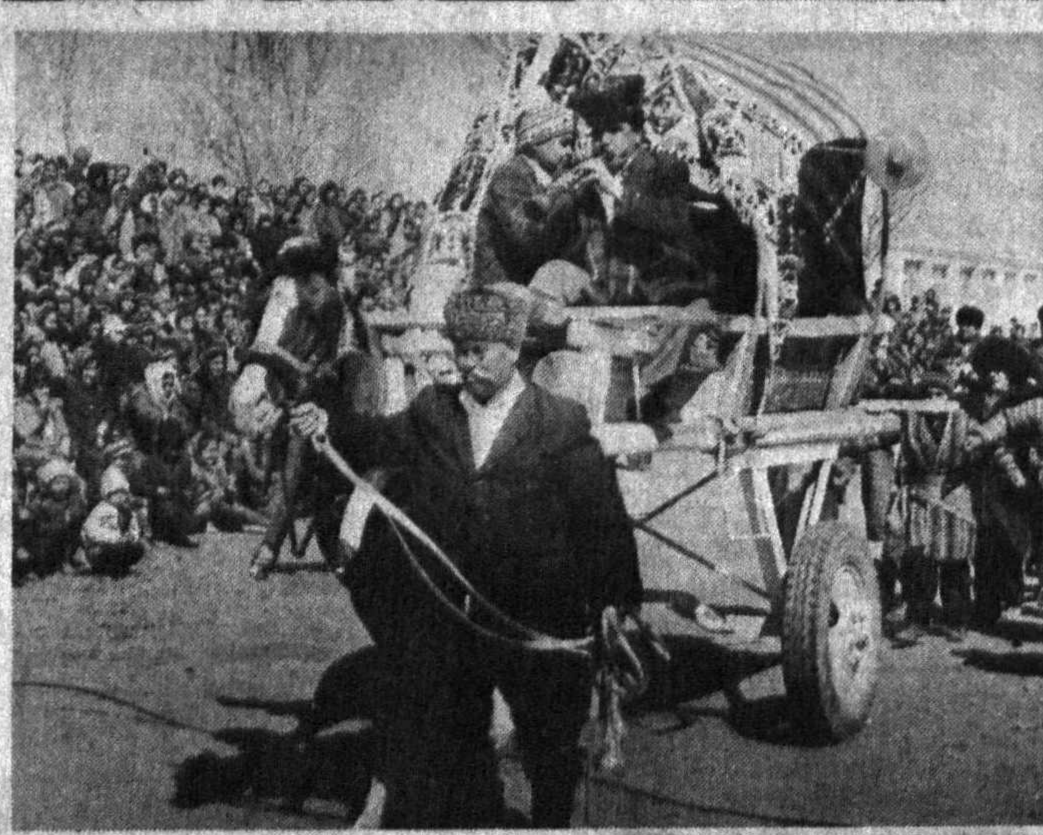
СУРАТЛАРДА: катта тўйдан лавҳалар.