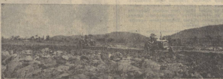
АФРИКА. Мариазий Африка Республикасининг ҳукумати қишлоқ хўжалигига қатта эътибор беришмоқда. Қишлоқ деҳқонлари техника, уруғ ва ўғитлар билан таъминлаб турилади. Суратда: тракторлар Баги яқинида ер ҳайдапди.

Левин Бирлашган Миллатлар Ташкилати Бош Ассамблеясининг 1967 йилги махсус сессиясида Буюк Британия делегациясига бопчилик қилган ҳамда Исроил қўшинларини араблардан босиб олган ерлардан дарҳоз олиб чиқиб кетиш тўғрисида Исроилга янган виждани жанжал билан тугади. Браун бўлганлигини эслаб ўтмоқ керак. Браун ташки ишлар министри лавозимини эгаллаб турган бир пайтда Исроил агрессорларнинг қўлда-қувватлаш сиевати таркиб топан эди. Англия ҳукумати шу сиебатни ҳозирги кунда давом эттирмоқда.