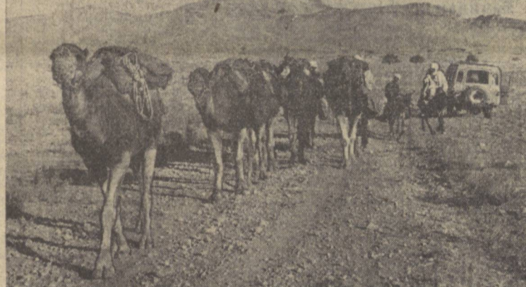
ЖАЗОИР. Жазоир Халқ Демократик Республикасининг Шарқий районларининг илдин шаҳри яқинида оғир. Бу район аҳолисининг бир қисми мол учун сув ва озуқа излаб ҳа миша кўчиб юради. Суратда: кўчманчи жазоирликлар янги манзилга кетишляпти.