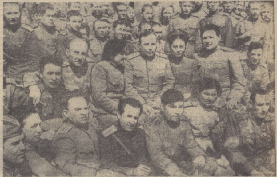
УЛУГ Ватан уруши йилларида 1-Украина фронтинда ўзбек, қозоқ, татар тилларида чиққан «Ватан шарафи учун» ва «Ватан номи учун» газеталарининг жангчи мухбирлари кенгазининг иштирокчилари. 1944 йил, май.