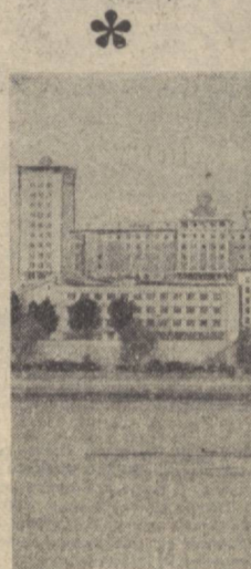
КХДР. Мамлакат пойтахтида янги, замонавий бинолар кундан-кун кўпайиб, шаҳар ҳуснига ҳусн қўймоқда. Суратда: Пхеньянинг Тэдонган дарёси соҳиллари кўриниши.

БОЛГАРИЯ. Республикада халқ маорифи соҳасида улкан ютуқларга эришилди. Мамлакатнинг етти бешга тўлган ҳар бир фарзанди партага ўтиради. Республикада минглаб янги мактаб бинолари тикланди. Суратда: Софиядаги ўрта политехника мактабининг 9 синфида физика машғулотли.