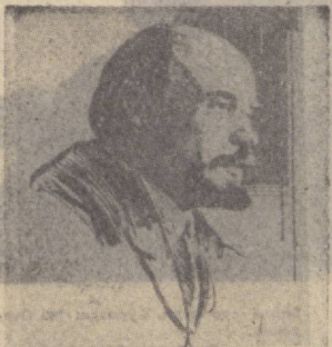
В. Д. СТАСОВА В. И. ЛЕНИН мана шундан киши эди