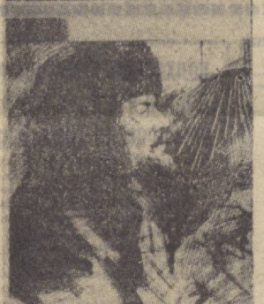
3 Воскресенская СОВУҚ ЗУМАТНИ ЕРИБ