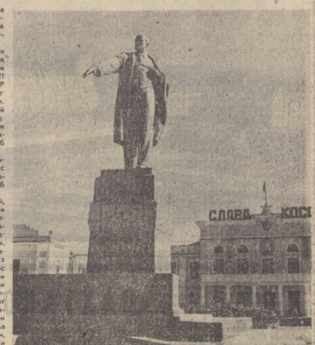
Суратда: Нукус шаҳридаги Революция майдонида В. И. Ленинга ўрнатилган ҳайял.