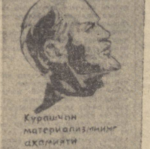
Курашчи материализмнинг аҳсолияти туғрисида