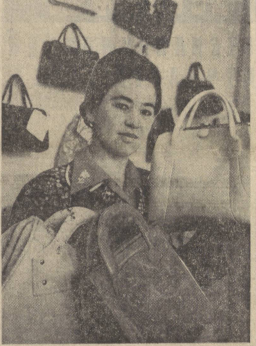
Тошкентдаги кўн-галатерия фабрикасининг коллектив 40 хилдан кўпроқ маҳсулот ишлаб чиқармоқда.

Шу кунларда республикада жамоатчилик ўзбек совет адабиётининг асосчиси Хамза Ханимовда Ниязий туғилган кунининг 90 йиллигига қизғин ҳозирлик кўрмоқда.