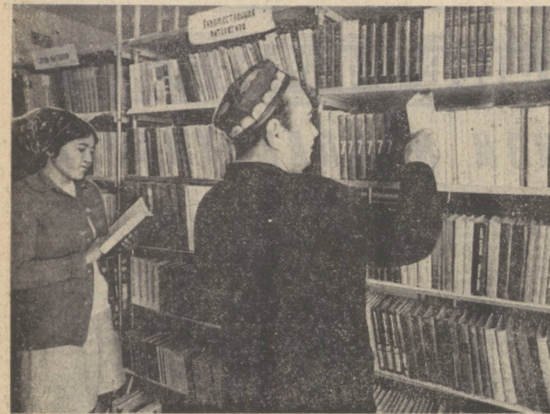
ЖИЗЗАХ ОБЛАСТИ. Дўстлик районидagi В. И. Ленин номидаги совхоз ташкил этилганга ўн йил бўлди. Шу вақт ичидa чуқуқарларнинг турмуш фаровонлиги юксалди. Хўжаликда истиқомат қилувчилар учун замонавий кotteжлар, кинита мантаб, шифохона қурилган. Маданият саройи ва кутубхона ҳам мунтазам ишлаб турибди. Совхоз кутубхонасида ўзбек, рус, қозоқ ва бошқа тилларда нашр қилинган 15 мингдан ортиқ китоб бор. Суратда: совхознинг бош кутубхонасида.