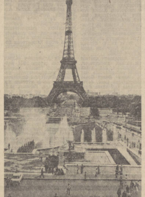
ПАРИЖ. Суратда: Франция пойтахтининг рами — Эйфелъ минораси.

Сессия иштирокчилари унинг якуловчи ҳужжатини қабул қилиш билан боғлиқ масалаларни кўриб чиқадилар. ↑ ПАРИЖ. Франция меҳнаткашларидан 160 миңдан кўпроқ киши корхона эгаларининг бебошлиғига қарши, ўз ҳуқуқларини қимом қилиш мақсадида март ойида забастовка ўтказишди. Шу ой давомида забастовка 197 корхонага ёйилди, ишчилар қўлаб меҳнатчиларнинг ишдан бўшатилишига қарши норозилик билдириб 14 та фабрика ва заводда ишчилар ш ташлашга эдилар. Умумий меҳнат конфедерацияси қасаба союзулари бирлашмасининг байётида таъкидлаб ўтилганча, ана шу забастовкаларнинг қўлаб Фран-