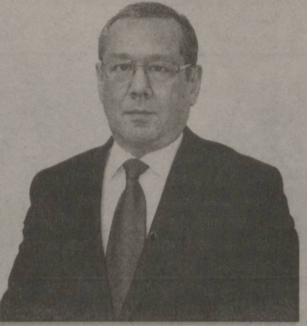
Улуғбек ИНОЯТОВ, ЎзХДП Марказий Кенгаши раиси, Олий Мажлис Қонунчилик палатасидаги фракцияси раҳбари