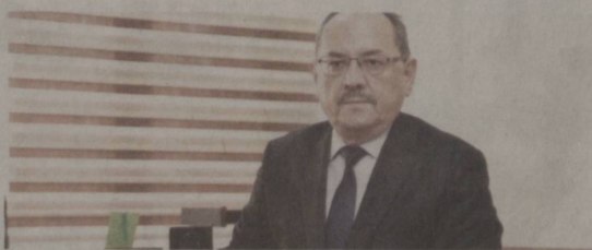
Нурмат Отабеков, Республика Бош давлат санитария инспектори.

Касаллик аниқланмаган ҳудудларда карантинни бекор қилса бўладими? — Йўқ, бўлмайди. Вазият тез ўзгариши мумкин. Бунини «яшил»дан «қизил»га айланган ҳудудларимиз мисолида ҳам кўриш мумкин.