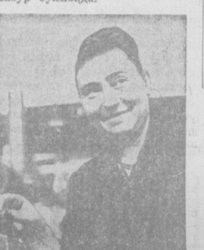
Тошкентдаги ишак-йигирув фабрикасининг коллективи В. И. Лениннинг 100 йиллик юбилейини муносиб кутиб олиш учун гайрат-айрат қўшиб ишлаб катта ютуқларни қўлга киритаётган.