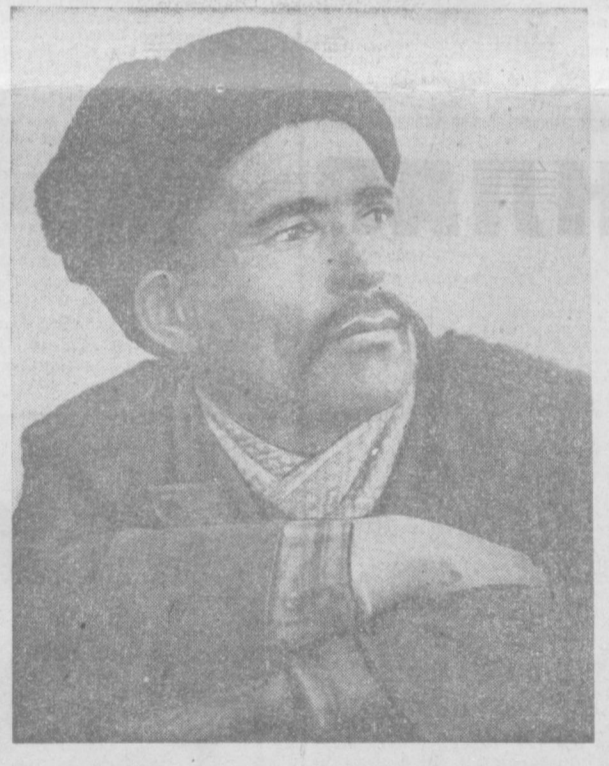
Бўстонлиқ районидagi Фрунзе номи колхоз чорвадорлари утган йили давлатга 56 тонна муни, қарийб 200 тонна гўшт сотиб моллари қишлоқдан соғлом олиб чиқиш учун пухта ҳўрлик кўриб қўйишган эди. Колхознинг сўзи билан иш бир бўлган ажил чорвадорлари ҳўзир ўз ҳалол меҳнатларининг баранали, мазмунли натижаларини кўришмоқда.