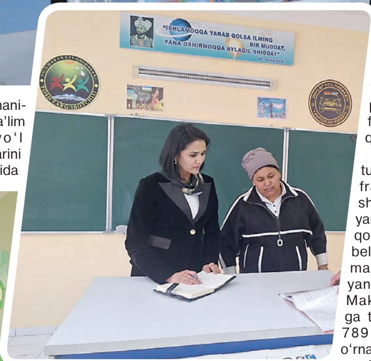
publika bosqichida faxrli 3-o'rinni qo'lga kiritdi.

Darvoqe, dastur asosida yo'l infratuzilmasini yaxshilash maqsadida yaroqsiz holga kelib qolgan 8022 ta yo'l belgisi yangisiga almashtirildi. 1636 ta yangi belgi qo'yildi. Maktablarning oldiga tezlikni cheklovchi 789 ta yo'l belgisi o'rnatildi. Shu bilan birga, aholi gavjum hudud-