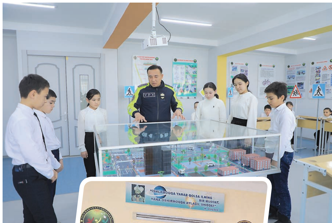
Farg'ona tumani-dagi 33-umumta'lim maktabida yo'l harakati qoidalarini o'rgatish borasida

«Yosh patrullar» jamoasi bir necha yildan buyon «Yashil chiroq» musobaqalarida faol ishtirok etib keladi. O'tgan yili jamoa musobaqaning res-