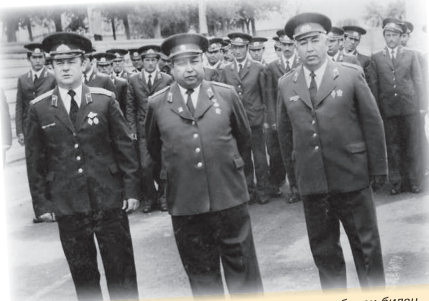
полковник Анвар Ҳожимуротов (ўртада) ҳамкасблари билан.

– Анвар ака ички ишлар органларидаги хизмат фаолияти давомида аҳоли тинчлик-хотиржамлиги йўлида кўплаб ишларни амалга оширди. Жумладан, жиноятчилик ва ҳуқуқбузарлик сонини кескин камайтириш ва уларга чек қўйиш мақсадида тумандаги қоронғи кўчаларнинг барчасига чироқ ўрнатди, тарбияси оғир ва жиноятчиликка мойиллиги бўлган ёшлар учун ИИБ билан