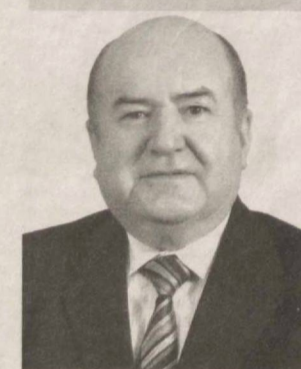
Қаландар АБДУРАҲМОВ, академик

Мамлакатимизда ҳозирги вақтда деярли ҳар кун улкан янгилик ва ўзгаришлар содир бўлмоқда. Бу, ўз навбатида, тараққиётимиз суръатлари нақадар тезлашиб, уларнинг натижадорлиги кўб бораётганини кўрсатади. Энг муҳими, бундай кенг қўламли ислохот ва янгиликлар аниқ мақсадга — мамлакатимиз ривожини янги bosқичга олиб чиқиш, халқимиз фаровонлигини оширишга қаратилгани билан беқийс аҳамиятга эгадир.