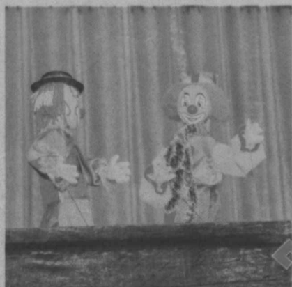
томоша залига кўтариладилар.

Республика кўғирчоқ театрида 24 декабрдан бошлаб янги йилнинг 9 январигача кичкинтойлар учун ҳар кўни икки маҳал «Қор маликаси» спектакли ўзбек ва рус тилларида намойиш этиб борилади. Бу томошалар театрга кириш жойида бошланиб, болажонларни эртак қаҳрамонлари, Қорбобо ва Қорқиз кутиб олади. Болалар улар билан ўйинга тушишди, шеър айтишди, кейин