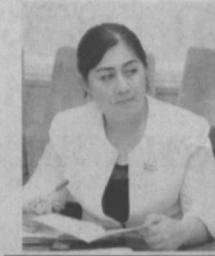
Феруза ЭШМАТОВА, Олий Мажлис Қонунчилик палатаси депутаты, Ўзбекистон ХДП фракцияси аъзоси:

Янги йил арафасида қабул қилган «Ўзбекистон фахрийларини ижтимоий қўллаб-қувватлаш «Нуроний» жағма-маси фаолиятини янада такомиллаштириш чора-тадбирлари тўғрисида»-ги Фармон юртимиздаги барча отахону онахонларимизга энг қадрли байрам совғаси бўлди.