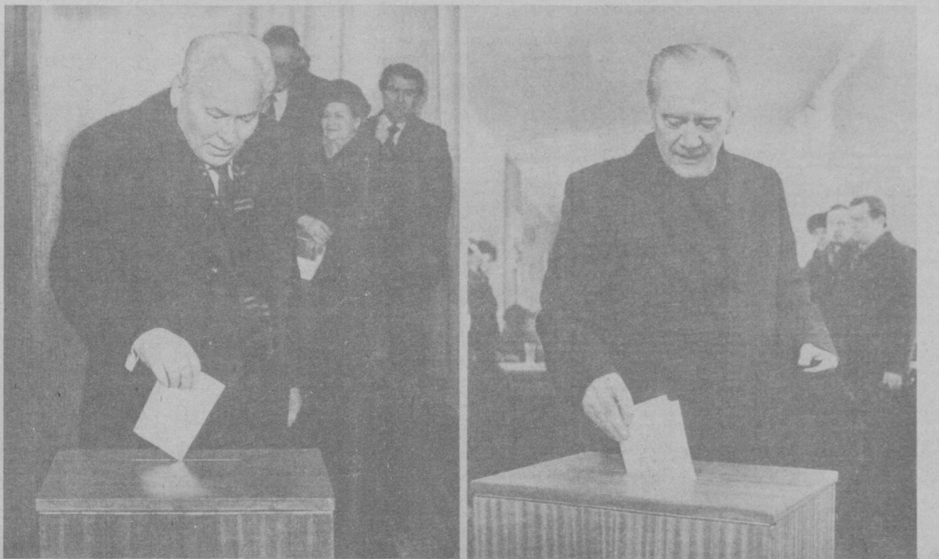
МОСКВА, 4 март. СССР Олий Советига сайлов. К. У. Черненко билан Н. А. Тихонов сайлов участкаларида. (ТАСС — УТАГ телефотоси).

Шубҳа йўқки, мамлакатимиз олий органига сайланган вакилларимиз эл ишончини оқлаш учун бутун куч-қувватларини аямийларди, партия ва халқ ишига садоқат билан хизмат қилдилар.