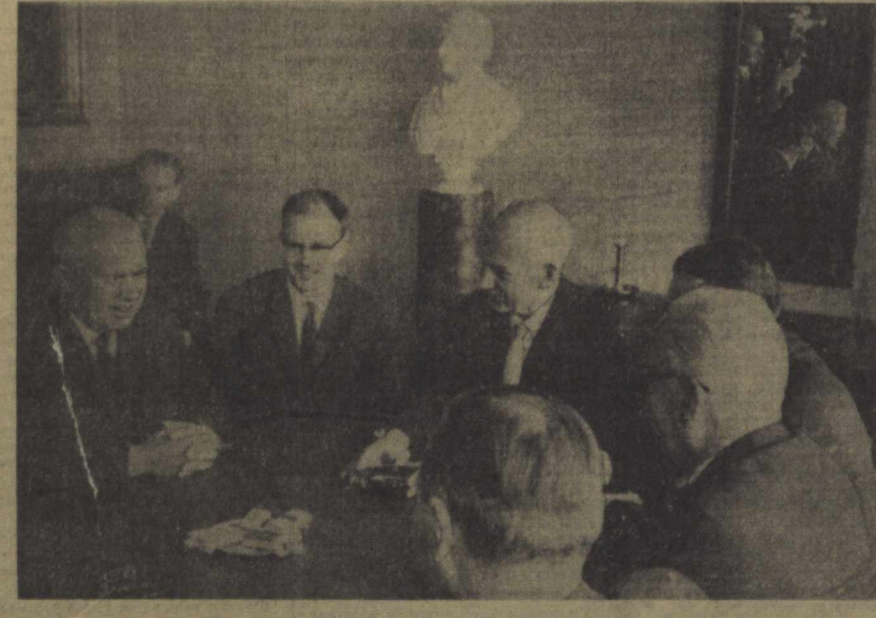
ОСЛО, 29 июнда СССР Министрлар Советининг Раиси Н. С. Хрушчев Норвегиянинг Бош Министри Э. Герхардсен хузурида бўлди. АП—ТАСС фотоси. (Фототелеграф орқали олинган).