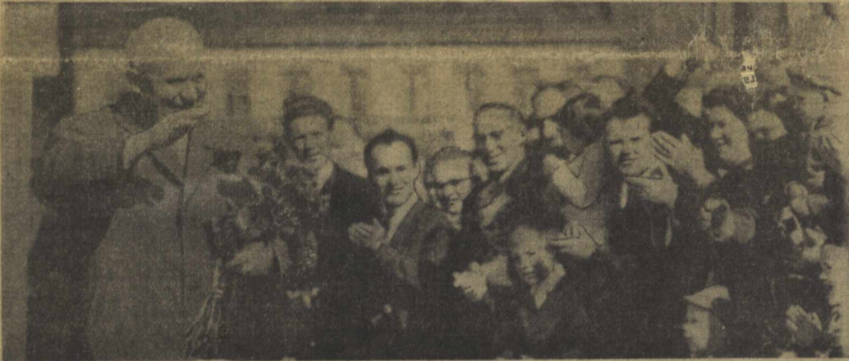
СССР Министрлар Советининг Раиси Н. С. Хрушчев ва унинг ҳамроҳлари расмий визит билан Ослода илдилар. Суратда: Норвегия пойтахтининг меҳнатнашлари Н. С. Хрушчевни кутламоқдалар.

ОСЛО, 29 июнь. (ТАСС махсус мухбирлари). СССР Министрлар Советининг Раиси Н. С. Хрушчев бугун ҳукумат биносига бориб, Норвегия Бош Министри Э. Герхардсен хузурида бўлди. Н. С. Хрушчев билан Э. Герхардсен ўртасида дўстона суҳбат бўлиб ўтди. Суҳбатда совет томонидан СССР Ташқи ишлар министри А. А. Громико, СССР Министрлар Совети Чет эллар билан маданий алоқалар давлат комитетининг раиси С. К. Романовский, «Правда» газетасининг бош редактори П. А. Сатюков, «Известия» газетасининг бош редактори А. И. Аджубей, СССР қишлоқ хўжалик министрининг биринчи ўринбосари Р. Н. Сидяк, СССР ташқи савдо министрининг ўринбосари М. Р. Кузь-